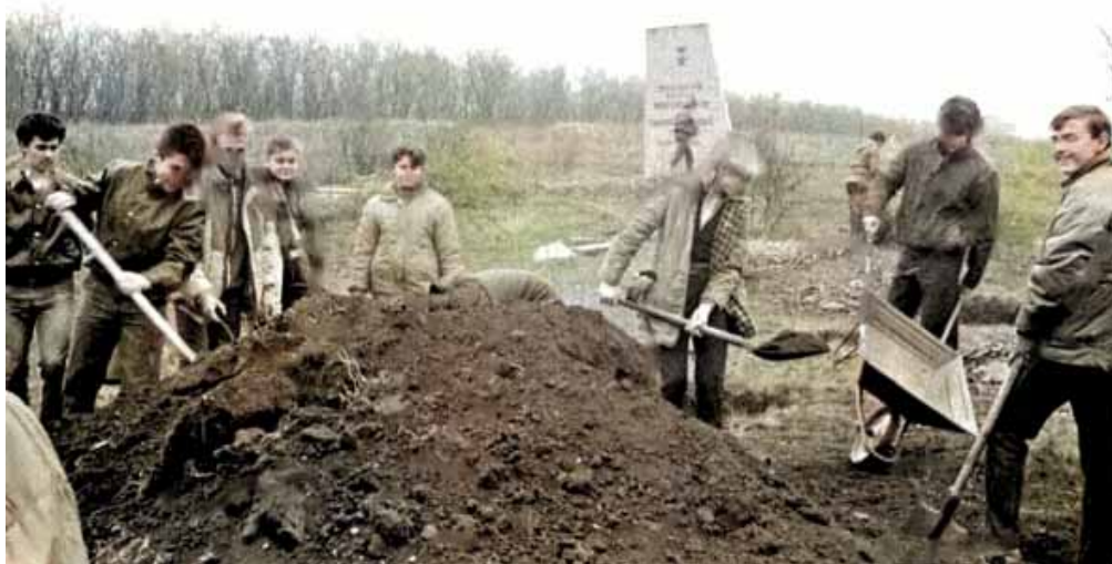
Княгиневка. Осень 1990 – весна 1991 гг. Создание мемориала на месте гибели разведчиков 383-й шахтерской дивизии.