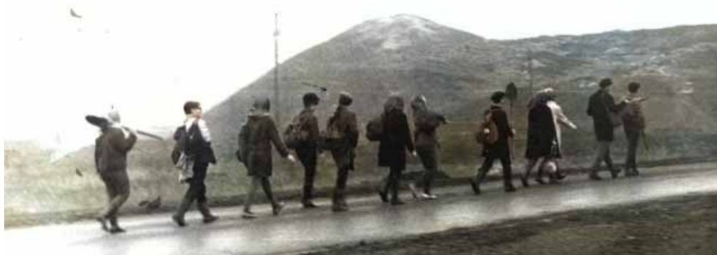
КНЯГИНЕВКА. 1970 г.