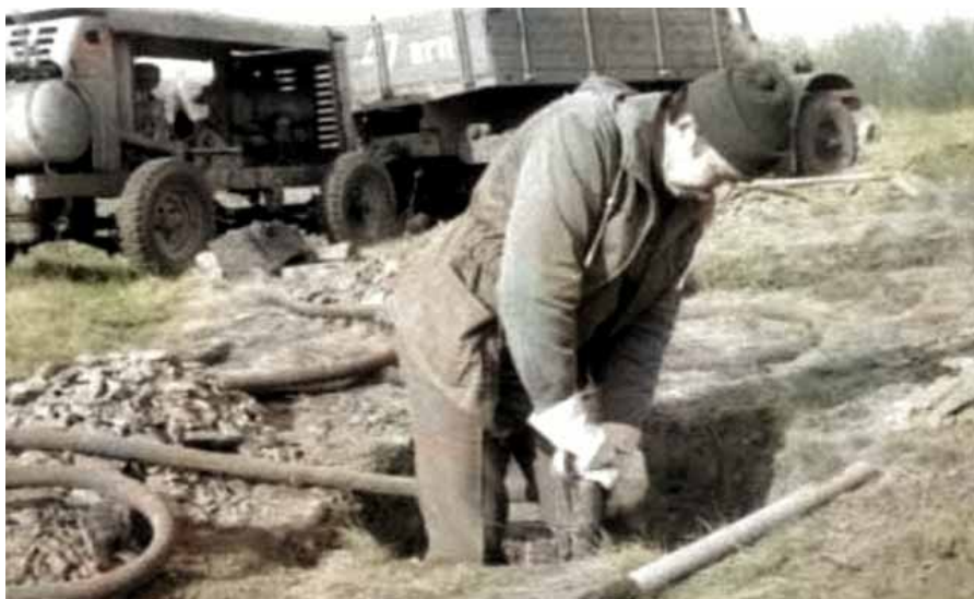
КНЯГИНЕВКА. 27 октября 1990 г.