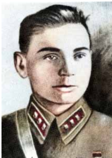
Железный Спартак Авксентьевич