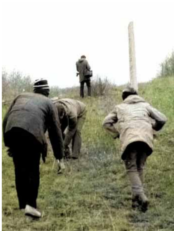
КНЯГИНЕВКА. 5–12 ноября 1989 г.