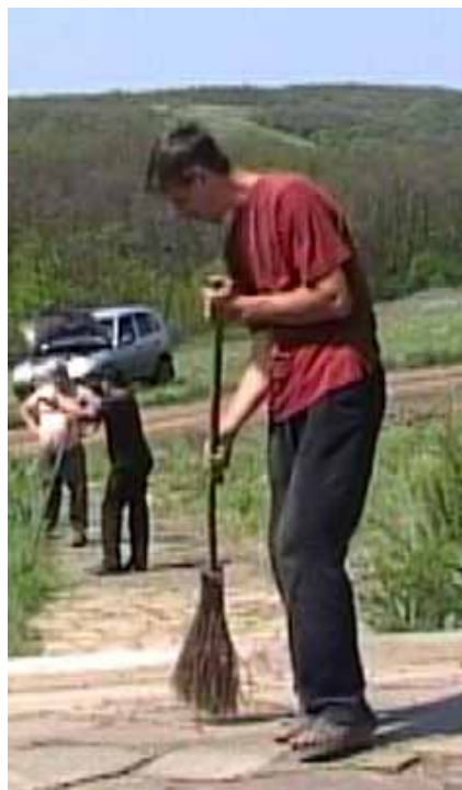
КНЯГИНЕВКА. 5 мая 2012 г.