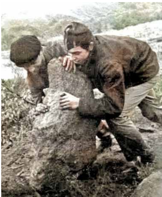
КНЯГИНЕВКА. 21 сентября 1969 г.