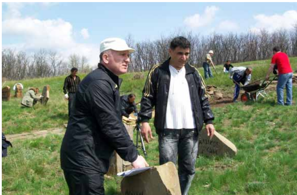
КНЯГИНЕВКА. 25 апреля 2010 г.