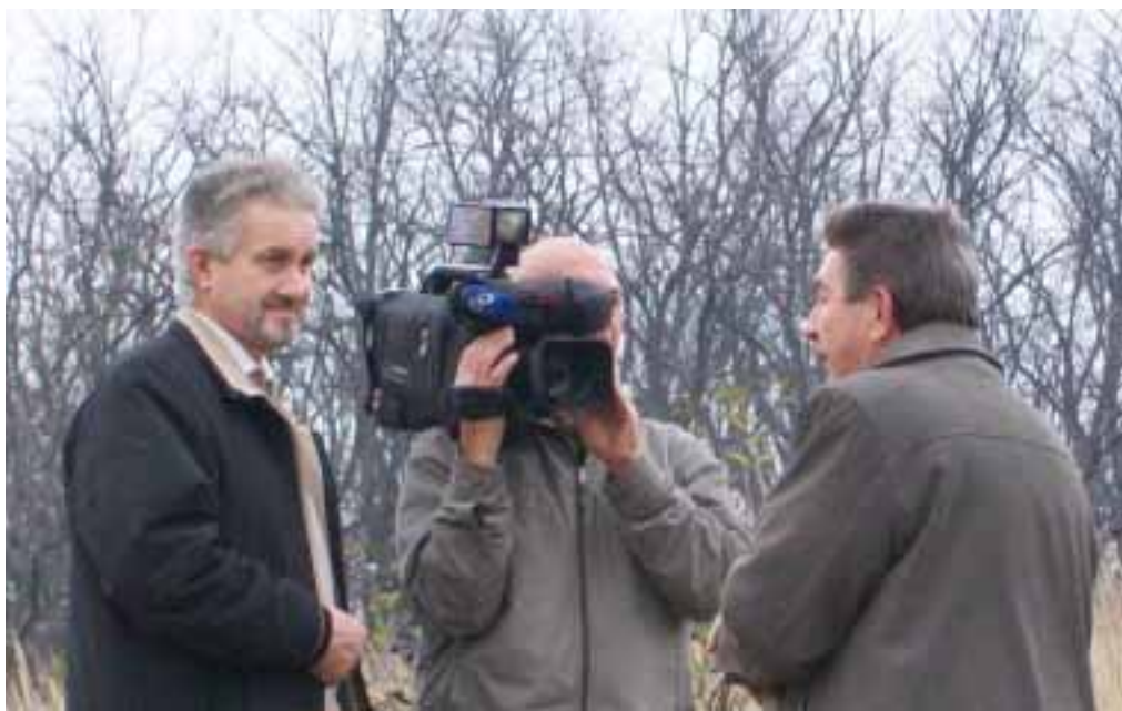
КНЯГИНЕВКА. 8 ноября 2010 г.