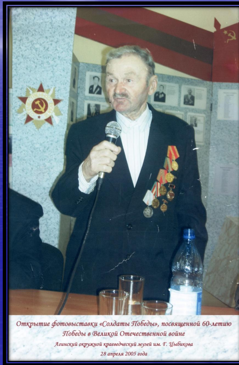
Открытие фотовыставки «Солдаты Победы», посвященной 60-летию Победы в Великой Отечественной войне Ягинский окружной краеведческий музей им. Т. Цыбикова 28 апреля 2005 года