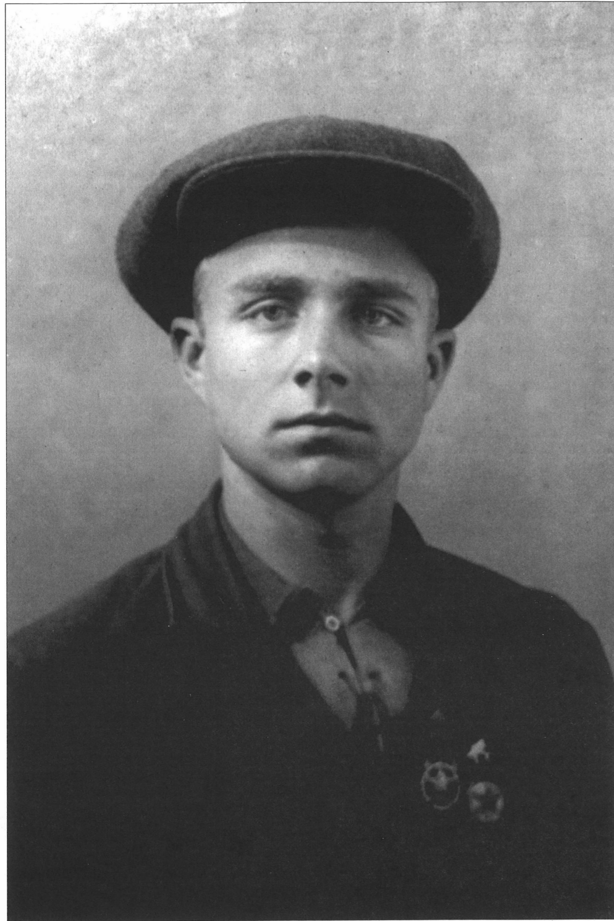
Учитель начальных классов. Фотография сделана 11 августа 1939 года в городе Боготол