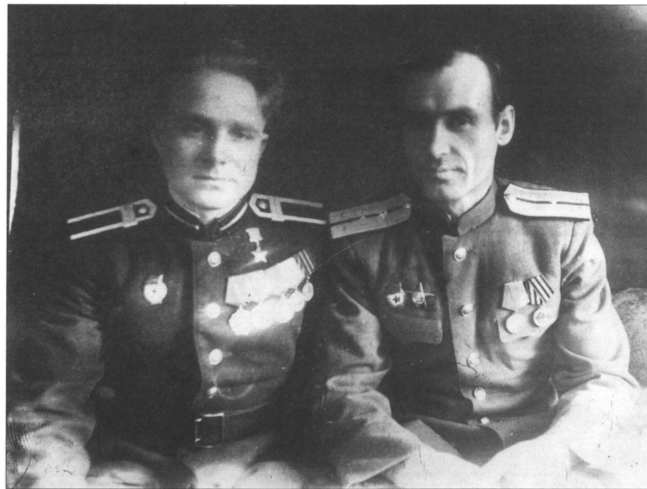
В Муромском училище связи. 1946 год

И вот утром 19 ноября мощная артиллерийская канонада, длившаяся больше часа, возвестила о начале контрнаступления наших войск под Сталинградом. Было пасмурно. Над передним краем стоял густой туман, что не позволило с утра применить нашу авиацию. От артиллерийской подготовки стоял сплошной гул, дрожала земля, не слышно было даже голоса рядом стоящего человека. Потом вперед пошли наша пехота и танки. Несмотря на мощный удар, враг оказывал упорное сопротивление. Ожесточенные бои часто переходили в рукопашные схватки. Но мы чувствовали свою силу, и настроение солдат было приподнятым.