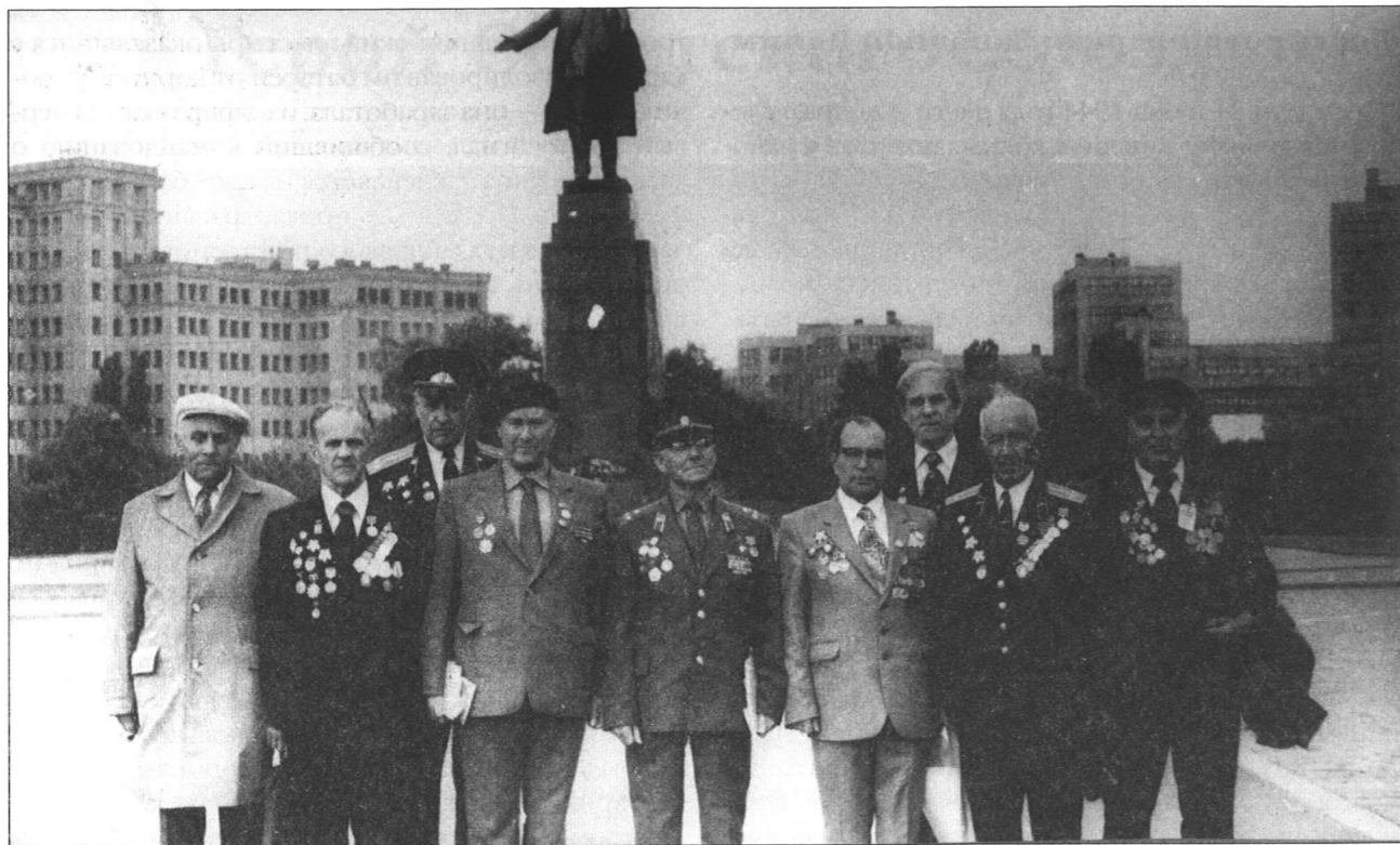
Встреча ветеранов 71-й Гвардейской ордена Ленина Краснознаменной Витебской стрелковой дивизии. 1971 год