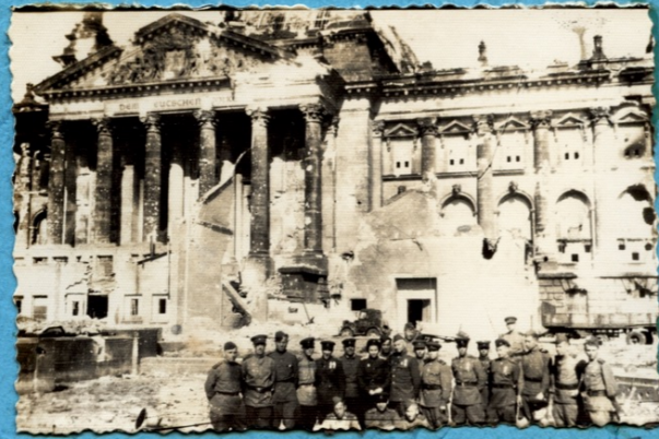
У Рейстага! 9.05.45

С боевыми дружинами на плацъ возле Рейстага и у исторических мест.