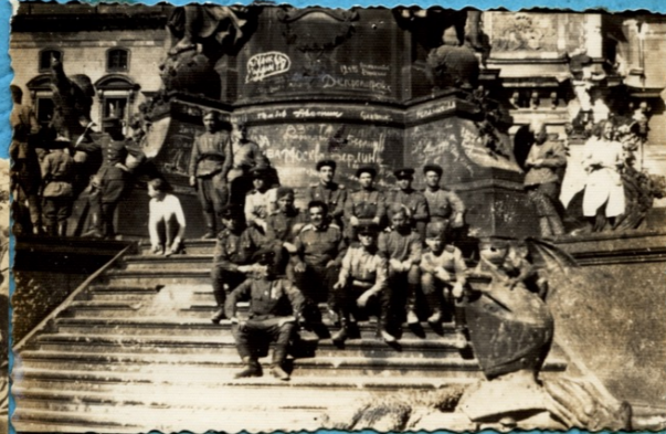
Александр плац / Росписи победителей...