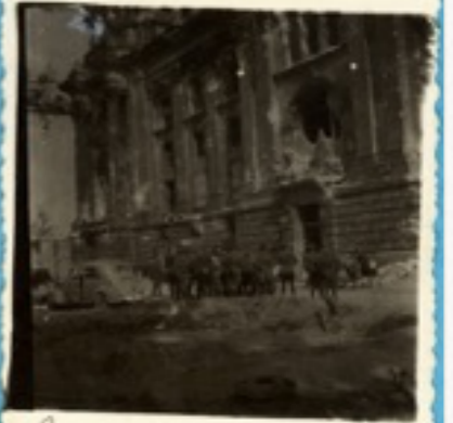
Еще не получили пламя и не забрали труны в Рейстаг