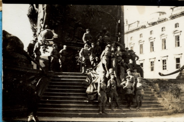
Мы победили!!! Ура!!!