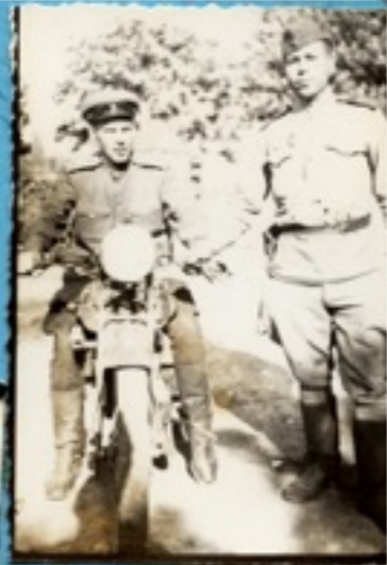
Над. Свѣж Букки ИИ