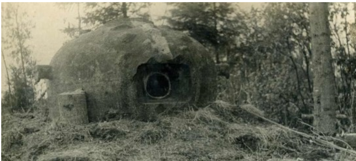
Район Свири. Стальной бронеколпак для пулемета, установленный в траншее.

24 июня умелым обходным маневром был разгромлен опорный пункт второй оборонной линии, созданной по последнему слову военного искусства.