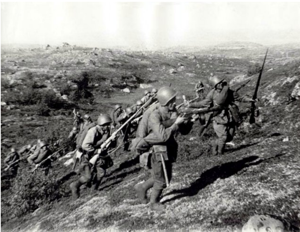
Наступление войск 14-й армии 7 октября 1944 года.

В связи с ненастной погодой авиация за первый день боев смогла произвести лишь 229 самолето-вылетов. И тем не менее наступление развивалось успешно. Воины стрелковых дивизий по грудь в ледяной воде с ходу форсировали реку Титовка.