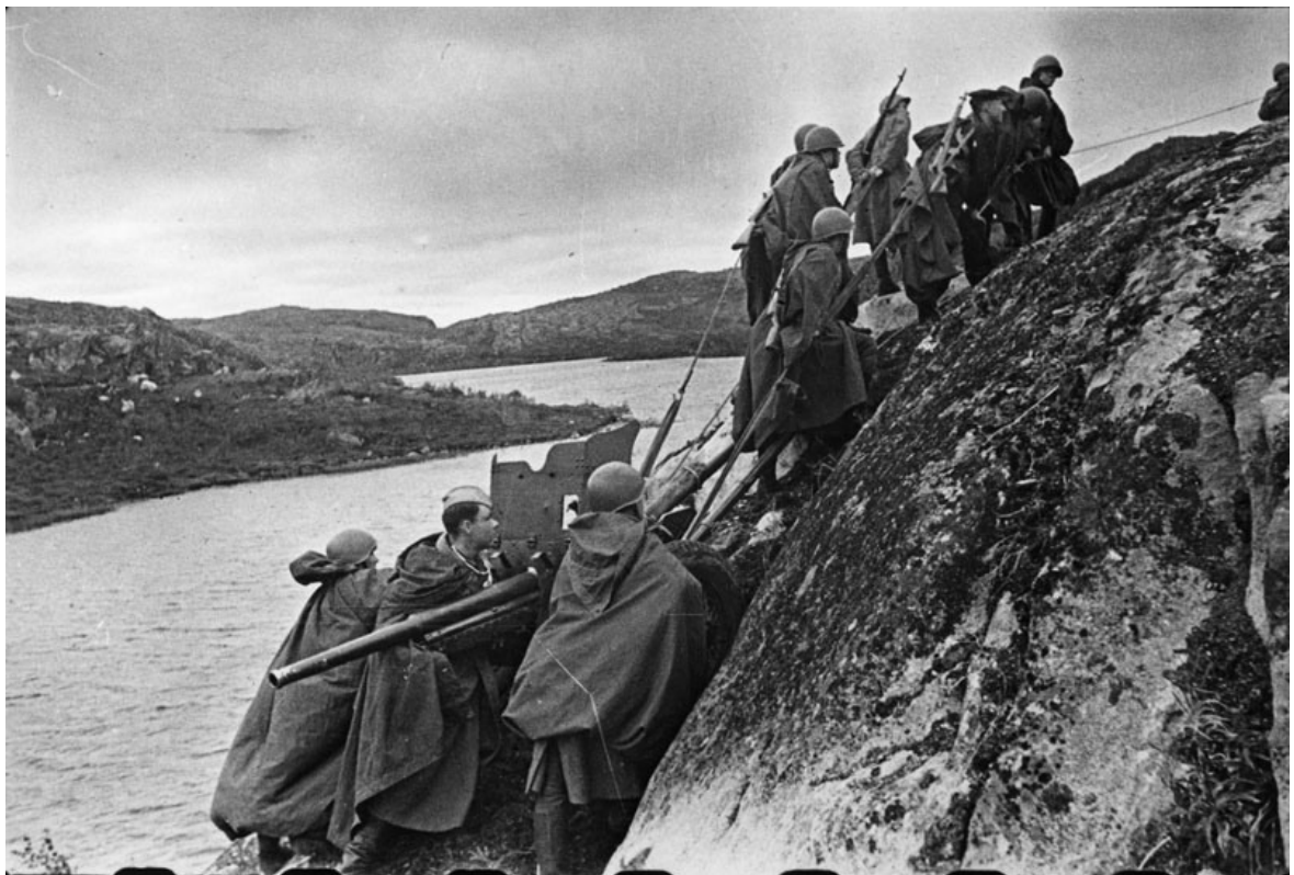
Форсировав реку Свирь, бойцы вручную поднимают пушки на скалистый берег.