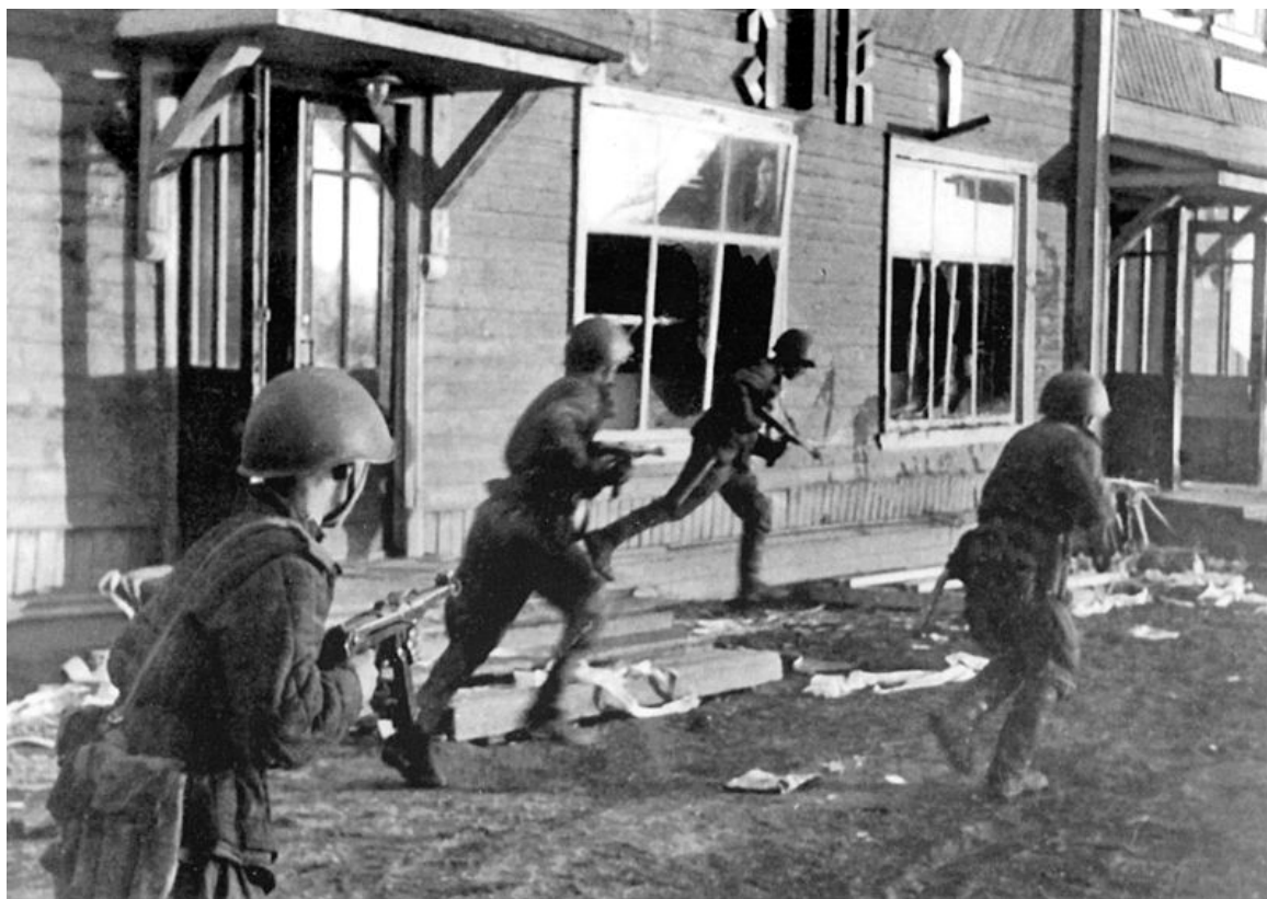
Автоматчики 763-го стрелкового полка 25 июня 1944 года ведут бой за город Олонец. Карелия.

24 июня умелым обходным маневром был разгромлен опорный пункт второй оборонной линии, созданной по последнему слову военного искусства.