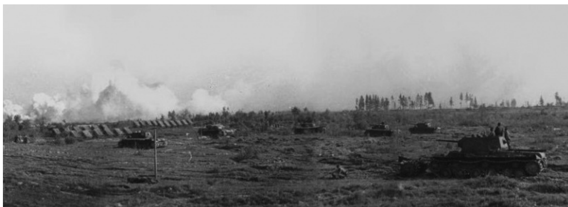
14-я армия пошла в генеральное наступление 7 октября 1944 года.