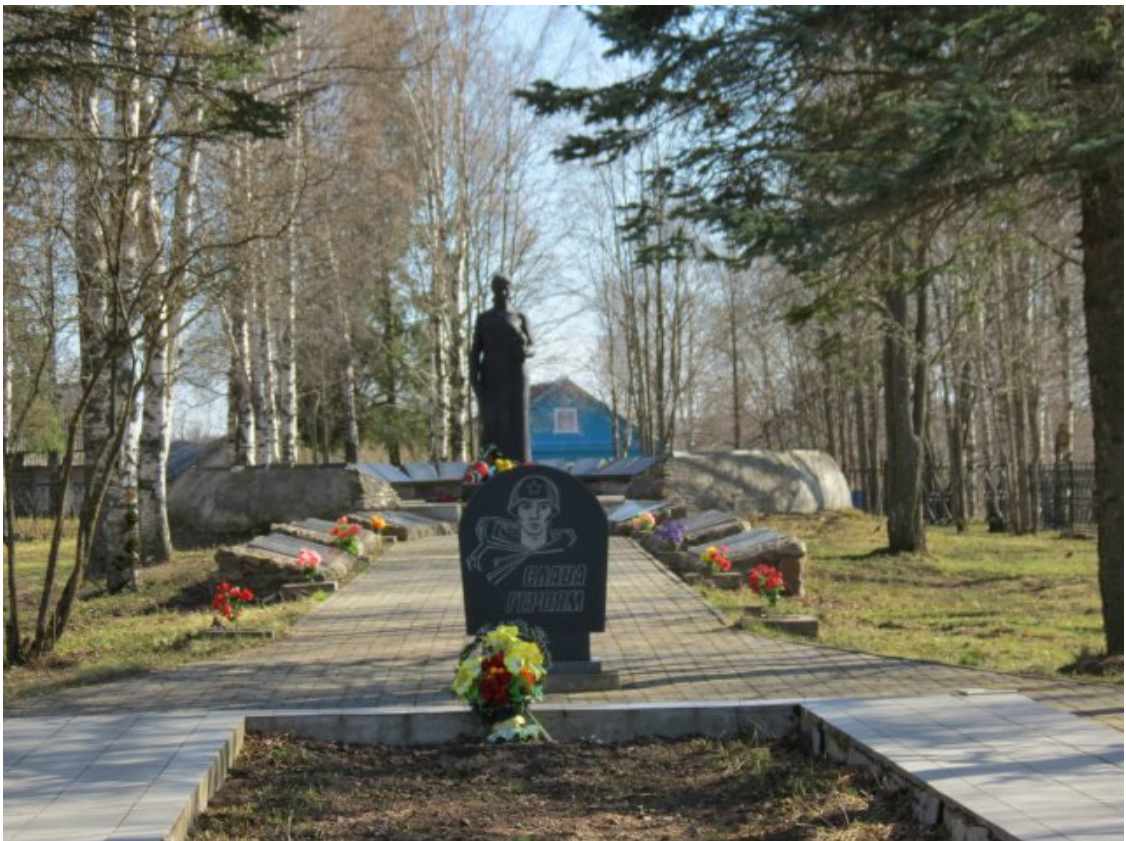
Мемориалы в поселке Ошта Ленинградской области на правом фланге линии обороны 114-й дивизии.