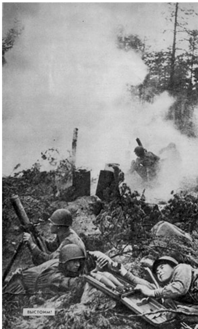
760-й минометный дивизион 114-й дивизии