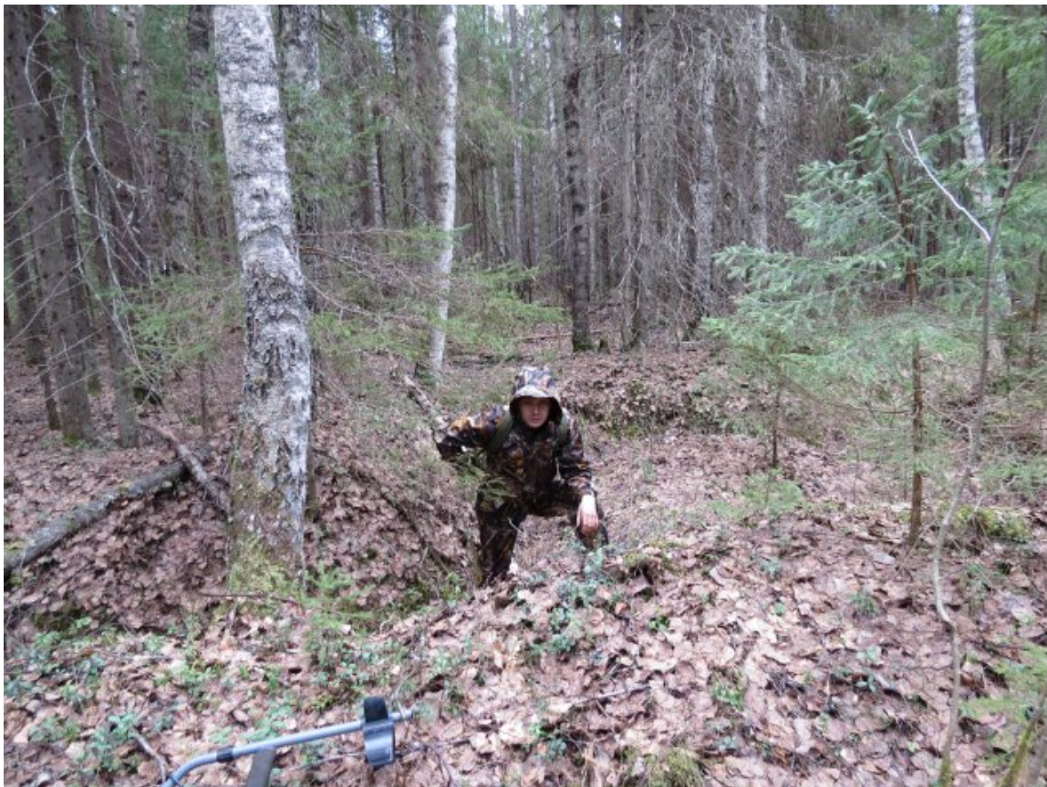
Здесь проходил рубеж обороны 114-й дивизии в 1941-42 году. Вместо спеленного леса вырос новый. Окопы и ходы сообщения обвалились.