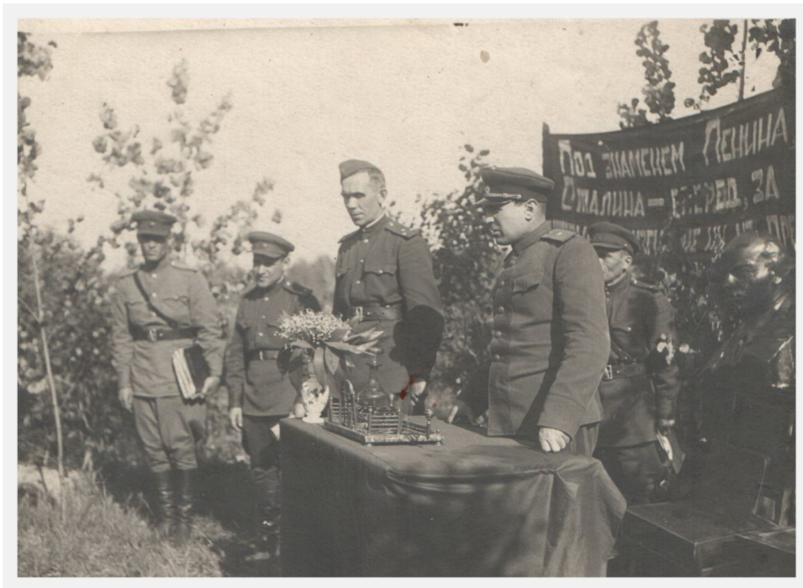
Митинг в 763-м стрелковом полку 114-й дивизии перед наступлением. Перед бойцами выступают командир дивизии, командир и комиссар полка.

Наконец-то наступил момент освобождать Карелию от врага. Этого ждали, к этому готовились, знали, что за крепкий орешек – финские укрепительные линии. Противник создал в этом районе глубоко эшелонированную оборону в 6 оборонительных полос, да и местность была сложной – леса, реки, озера, болота.