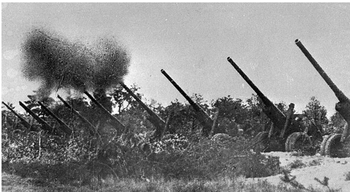
Артподготовка. 7 октября 1944 года.

Утром 7 октября после мощной артиллерийской подготовки, продолжавшейся 2 часа 35 минут, войска 14-й армии перешли в наступление. Основная тяжесть наступления в тот день легла на пехоту и орудия сопровождения, так как приданные танки и дивизионная артиллерия из-за бездорожья отстали.