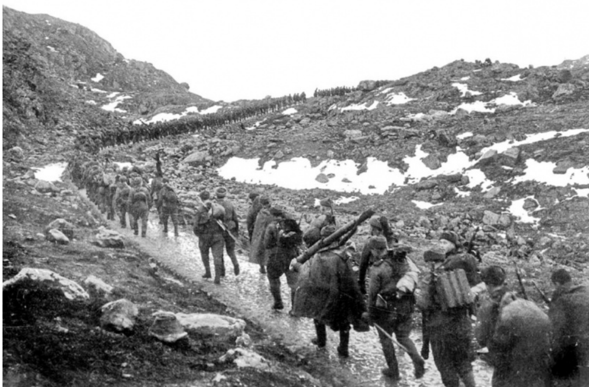
Бойцы 114-й дивизии на марше. Карелия, октябрь 1944 года.

В результате упорных боев войска 14-й армии во взаимодействии с силами Северного флота 15 октября освободили Петсамо и отбросили противника к западу и северо-западу от Петсамо и Луостари. В ходе операции они продвинулись вперед до 60 — 65 км, захватили 217 орудий и минометов, более 450 пулеметов и создали благоприятные условия для развития наступления к границам Норвегии.