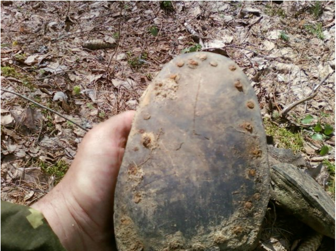
Каска и обувь пролежали в земле 70 лет