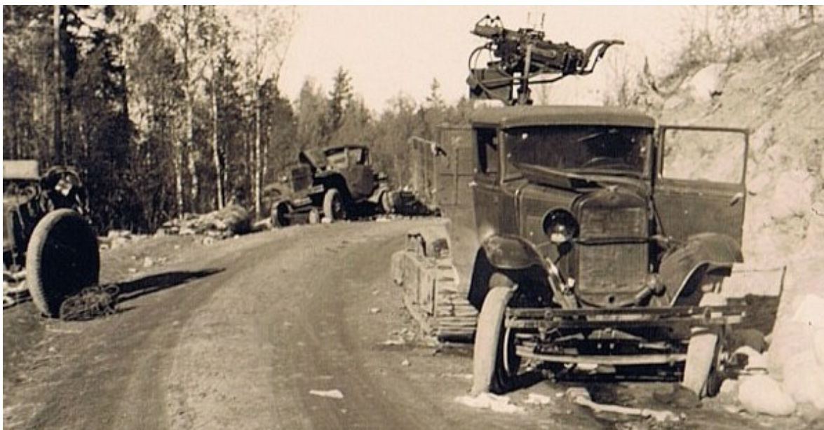
На дороге Пряжа - Петрозаводск разбитая наша и немецкая техника. На переднем Плане полуторка на гусеничном ходу. В кузове спаренный зенитный пулемет.