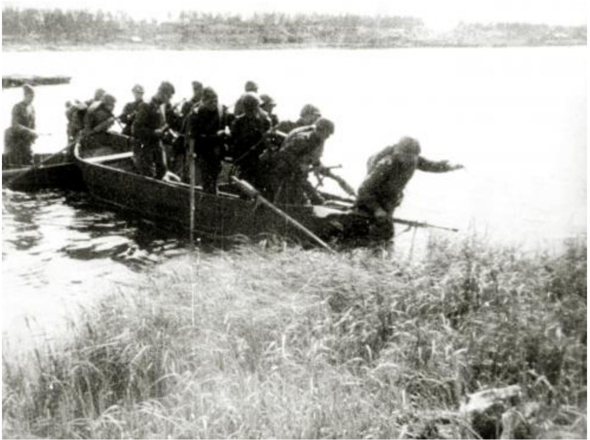
Переправа через реку Свирь 21 июня 1944 года.