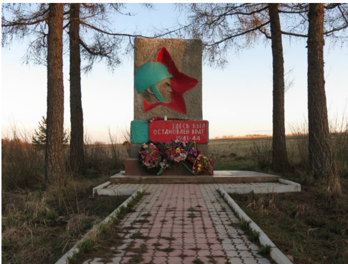
Стелла у поселка Ошта Ленинградской области.

В районе реки Свирь финнам удалось форсировать реку и захватить плацдарм шириной до 100 километров и до 20 километров в глубину на южном берегу Свири. Финнам осталось пройти около 125 км до Тихвина. В этом случае замкнулось бы второе кольцо вокруг Ленинграда, и всякая связь, кроме воздушной, была бы потеряна. К концу сентября ожесточенные атаки были отражены, и фронт на юго-западном и южном подступах к Ленинграду стабилизировался.