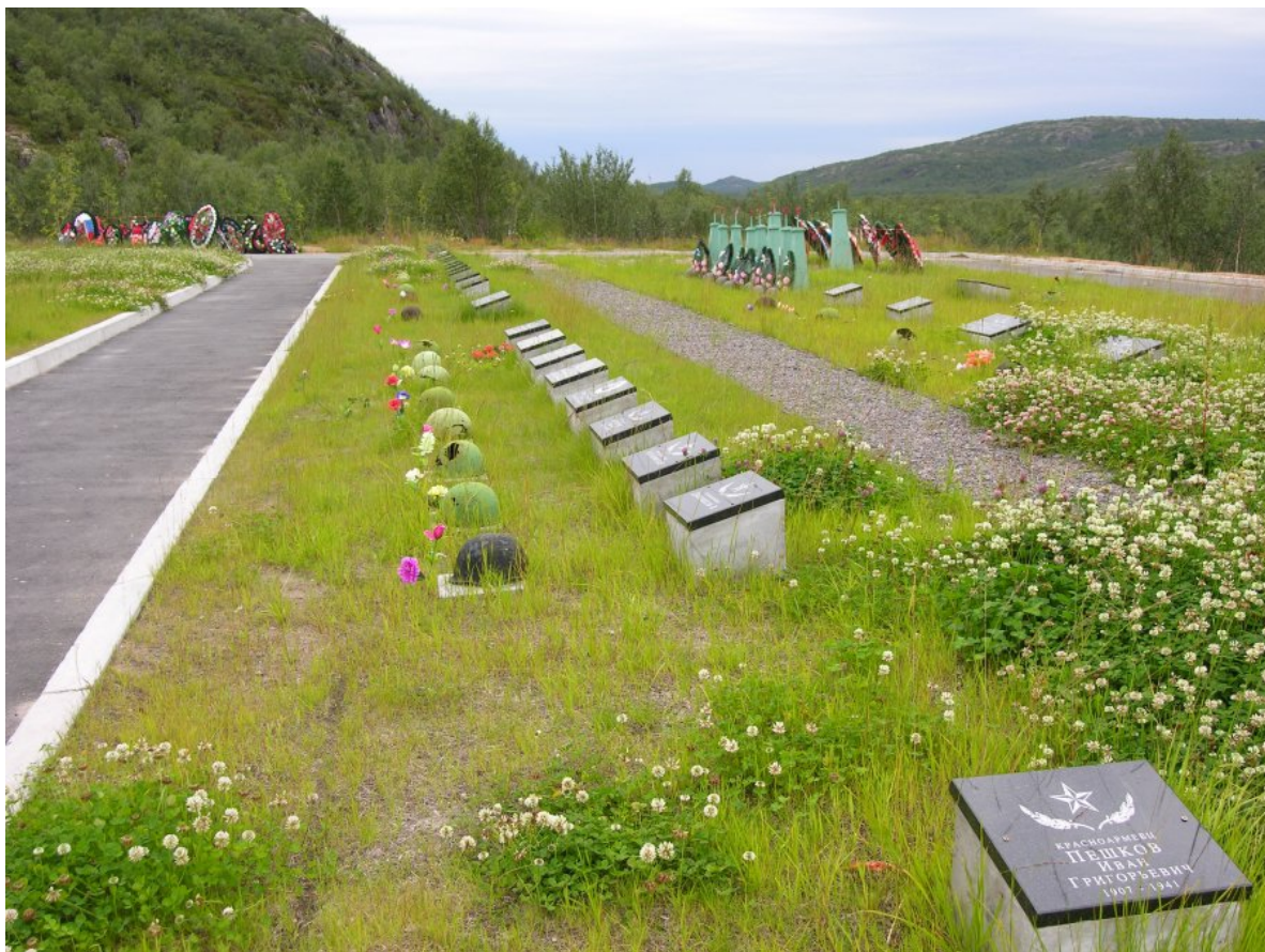
Долина Славы. Мемориал в долине реки Титовка.

К исходу дня войска 14-й армии прорвали оборону противника на участке до 6 км по фронту и продвинулись до 8 км в глубину.