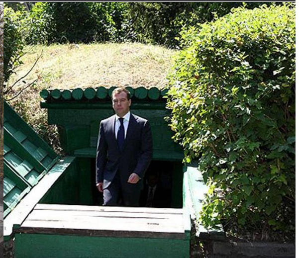
Музей «Штаб Центрального фронта». п. Свобода.