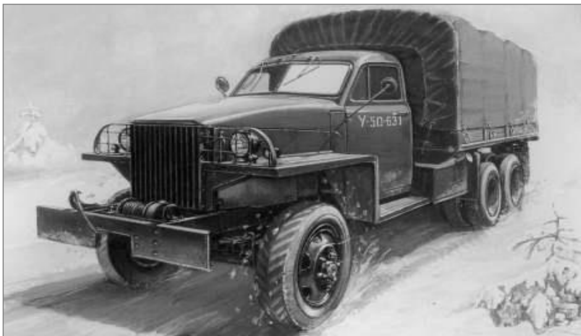
«Весна в тот год была поздняя, и по крепкой еще, утренней дороге, водитель гнал во весь опор...»