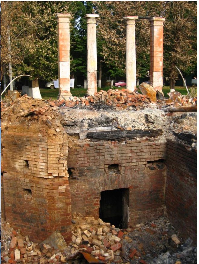
Усадьба «Богородское-Красково», князей Голицыных – Трубецких – Орловых – Оболенских в разные годы.