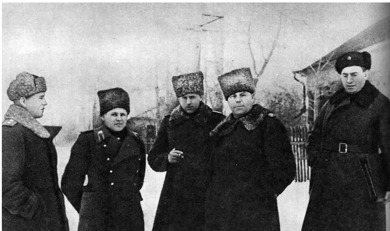
Предст. Ставки ВГК, нач. Ген. штаба А. М. Василевский и его зам. А. И. Антонов в штабе Центрального фронта (слева направо): И. Т. Пересыпкин, К. Ф. Телегин, К. К. Рокоссовский, А. М. Василевский и А. И. Антонов, Поселок Свобода Курской области, март 1943 г.