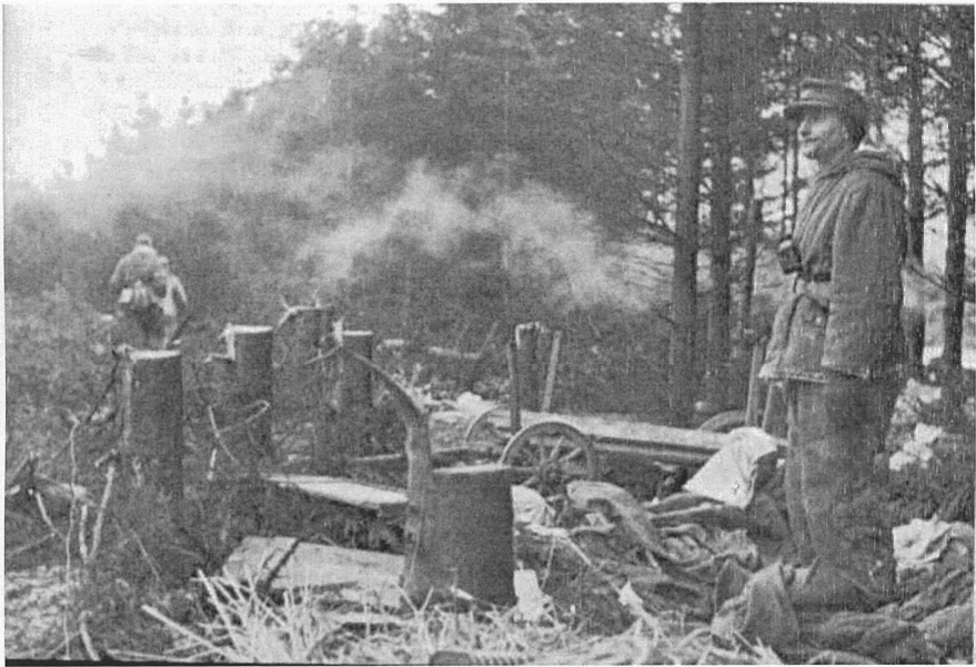
Русская позиция у Ландграбена захваченная в бою в начале прорыва из Кёнигсберга

В указанное время полностью сопротивление было сломлено лишь вдоль пиллаусской дороги, в районе женской школы, транквицкой дороги, включая кирпичный завод и дворянское поместье. Танкисты и мотопехота смяли оба фланга 945-го сп и овладели северо-восточной и восточной частью Метгетена. 940-й сп полностью остался на своих позициях и лишь несколько завернул правый фланг южнее Филиппова пруда.