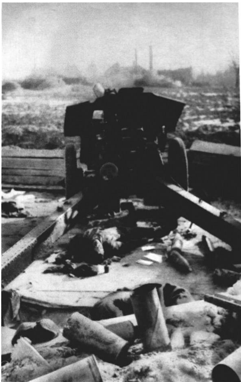
Russische „Ratsch-Bumm“ mit Schußvorrichtung auf Kalksteinwerk Moditten, im Sturm auf Metgethen genommen

Погибший расчет 122мм гаубицы 788-го артполка. На заднем плане дымовые трубы кирпичного завода