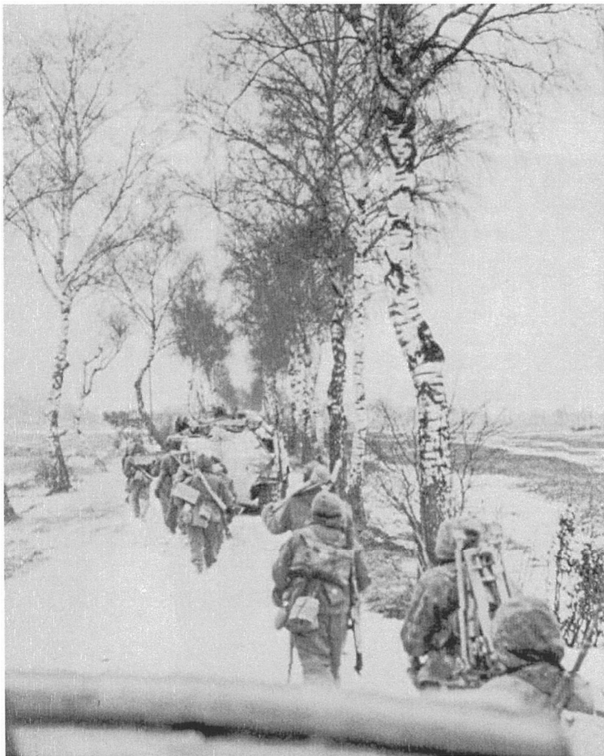
Солдаты боевой группы Малотка (Malotka) (22-й мотопехотный полк) 19 февраля 1945 севернее Метгетена.

На позиции дивизиона, потеснив разрозненные части отступающих пехотинцев 945-го сп, прорвалось порядка 18 единиц бронетехники. Артиллеристам 1-й батареи удалось уничтожить один тяжёлый танк и две самоходки (вероятно истребителей танков Jagdpanzer IV/70). После неравного