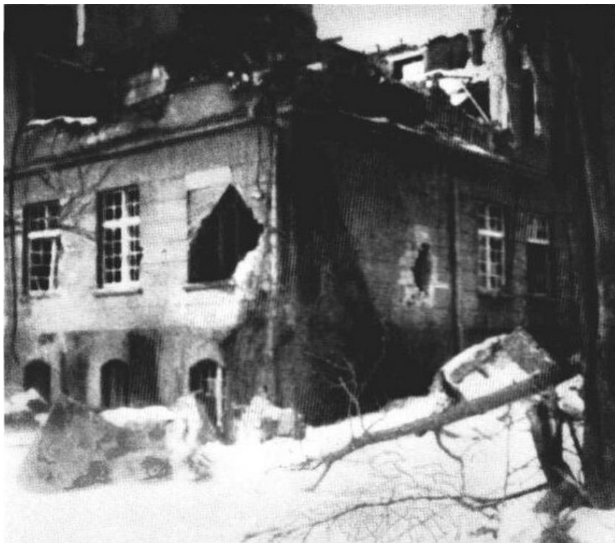
Die Frauenschule Metgethen nach dem Sturm am 19. Februar 1945