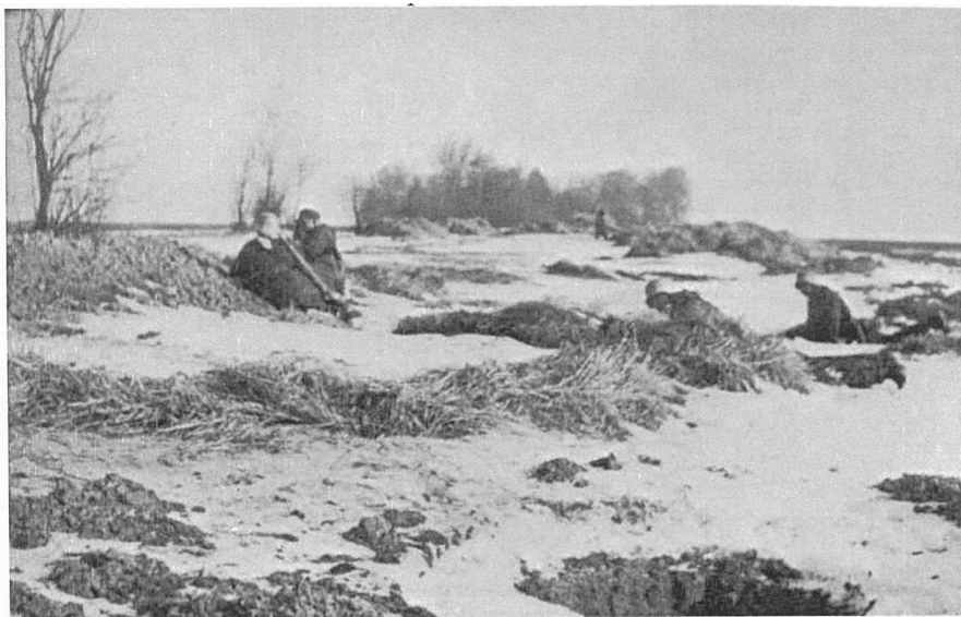
На передовой 20 февраля 1945 г. На высоте 40,2 у Транквица (севернее Метгетена).