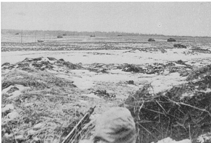
Остатки 5-й танковой дивизии при нанесении удара из Метгетена на Пиллау.

бронетехнике, но тяжелобронированные «Тигры» и «Королевские тигры» были недоступны для 76-мм орудий самоходок.