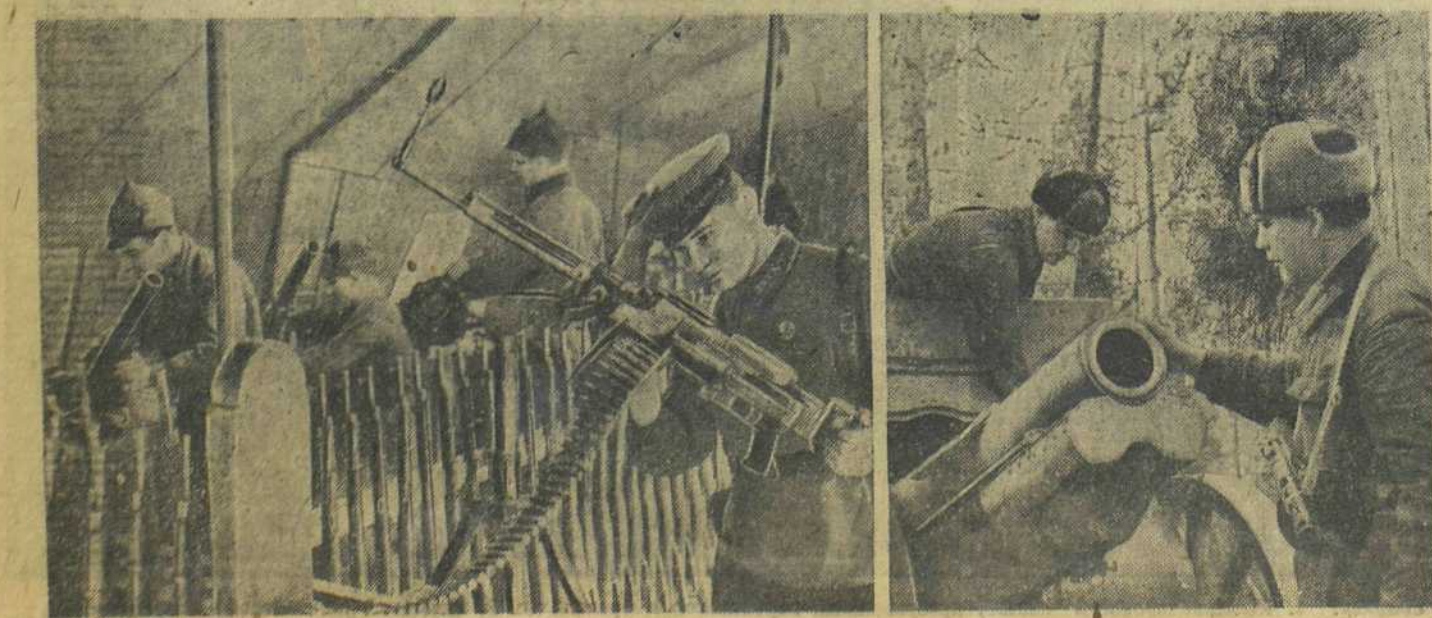
КАРЕЛЬСКИЙ ФРОНТ. Дивизионная артиллерийская ремонтная мастерская. На снимках: 1. В оружейно-пулеметном цехе. 2. Приемка отремонтированного орудия.

Наша авиация лишь за один день подбила 11 немецких танков, 86 автомашин, 6 орудий, уничтожила склад с боеприпасами и склад с горючим, четыре самолета (из них три на аэродроме) и три арестанта. Подожжена одна артиллерийская батарея. Кроме того, летчики разбомбили девять немецких эшелонов с боеприпасами.