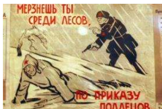
* Советский и финский агитационные плакаты.

17 февраля 7-я армия вновь перешла в наступление. Если дивизии ударной ее группировки преодолевали в сутки по 2 км, то войска 13-й армии практически топтались на месте. Лишь незначительного успеха на левом крыле 13-й армии достигли соединения 23-го стрелкового корпуса : в ходе жестоких боев они продвинулись на 4-5 км, преодолевая предполье оборонительной полосы. И все же к 18 февраля 15 и 23 корпуса 13 армии с боями вышли к главной оборонительной полосе, передний край которой проходил на этом участке по берегу реки Салмен-канте, озера Муолан-ярви и южной окраине Муола. Перед 23 корпусом в межозерье находился один из сильнейших узлов сопротивления – Муола-Ильвеский узел, имевший 25 дотов, 21 дзот, 4 железобетонных убежища, которые прикрывались мощными заграждениями.