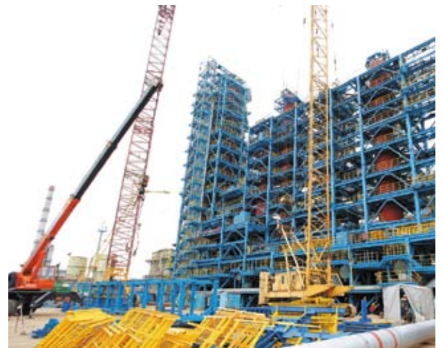
Монтаж этажерки по блоку 100 и 200 завершен.

муникаций по всем объектам общезаводского хозяйства. Специалисты нафтановского ПКО работают в этом направлении в активном темпе, ведь эта часть проекта по строительству комплекса АТ-8 очень объемная и требует участия многих заводских подразделений.