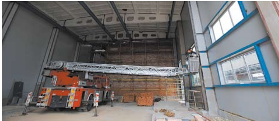
Ведется внутренняя отделка насосной реагентов.