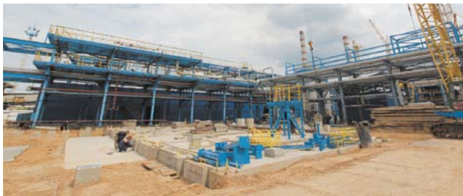
На этой площадке установят сырьевые насосы.