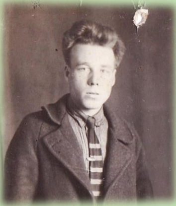
пропал без вести в августе 1941 г.