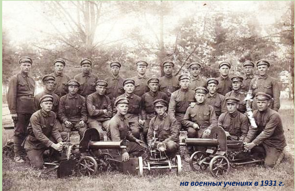
на военных учениях в 1931 г.