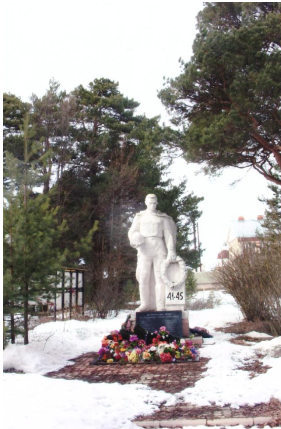
с. Липин Бор

Часто наблюдательные пункты миномётчики и артиллеристы устраивали и на деревьях для улучшения обзора с низкого места с целью корректировки стрельбы, чтобы пристрелять нужные ориентиры. Так было и в бою за город Вилкавишкис..