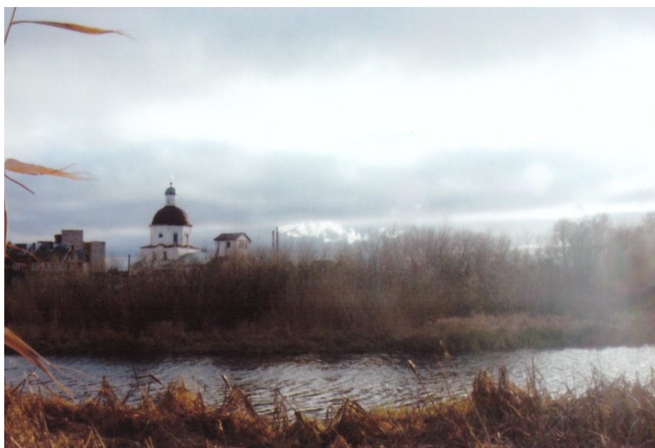
Церковь Святой Троицы с. Липин Бор