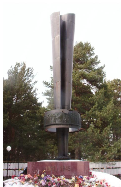
Обелиск защитникам Родины 1941-1945 гг. с. Липин Бор, Вашицкий р-он, Вологодской обл.