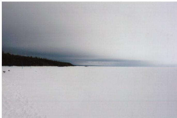
Родное Белое озеро

Матери, жёны, сестры, дети – все держались только надеждой, верой. Это давала силы жить, невзирая на невыносимые трудности, голод.