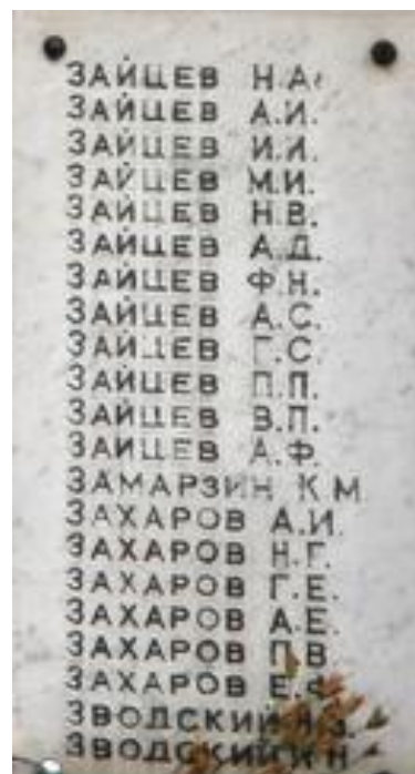
Одна из памятных плит павшим героям 1941-1945гг. с. Литин Бор