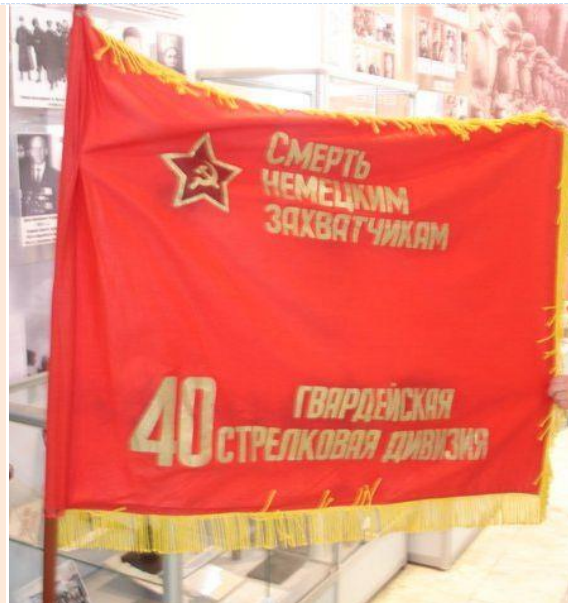
Знамя 40-й гвардейской стрелковой дивизии