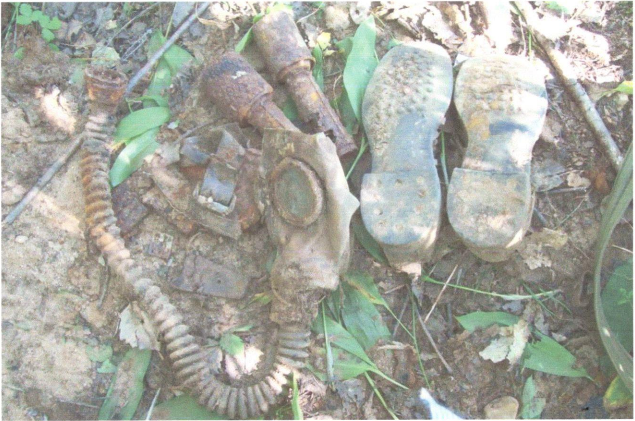
Остатки обмундирования убитого солдата