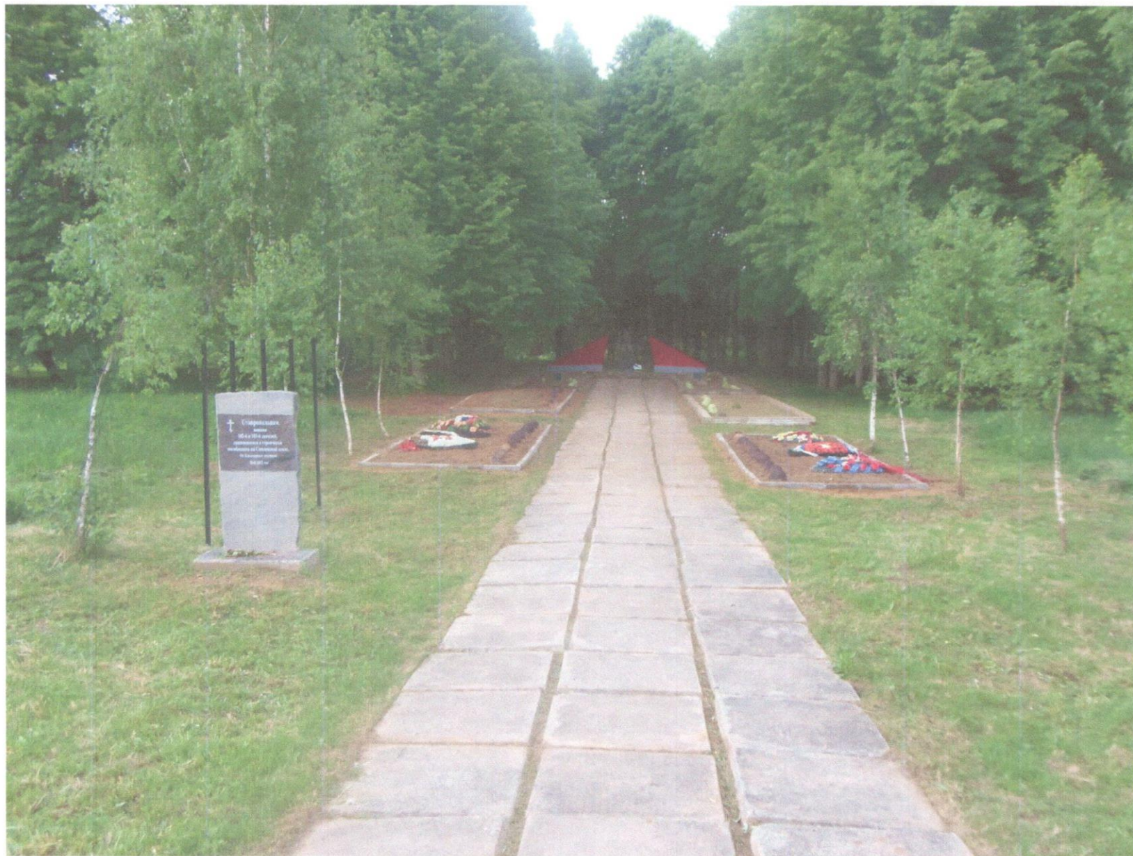
Братское воинское захоронение д. Яковлево (Поле Памяти) Глинковского района Смоленской области