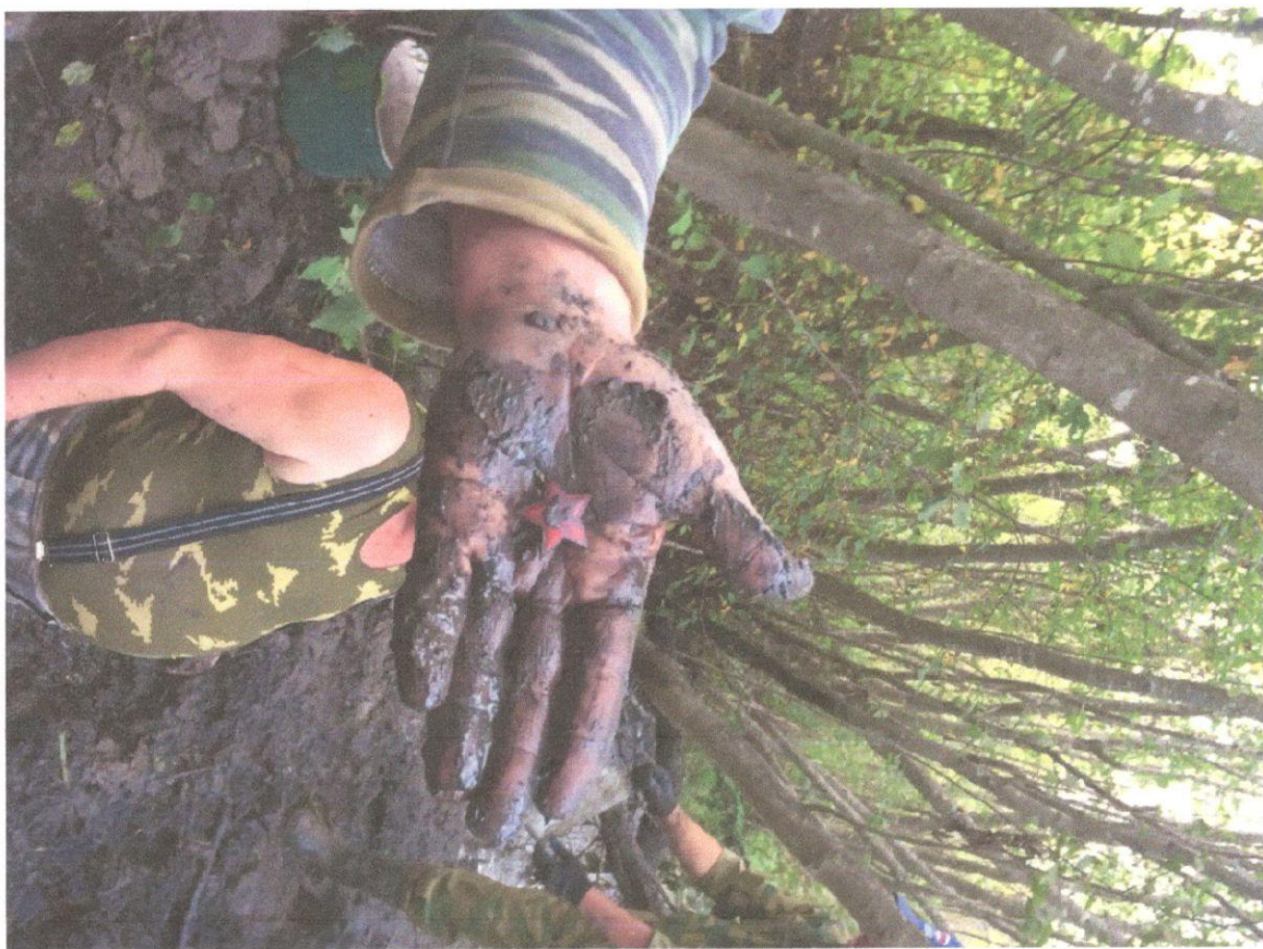
Звездочка с пилотки погибшего солдата