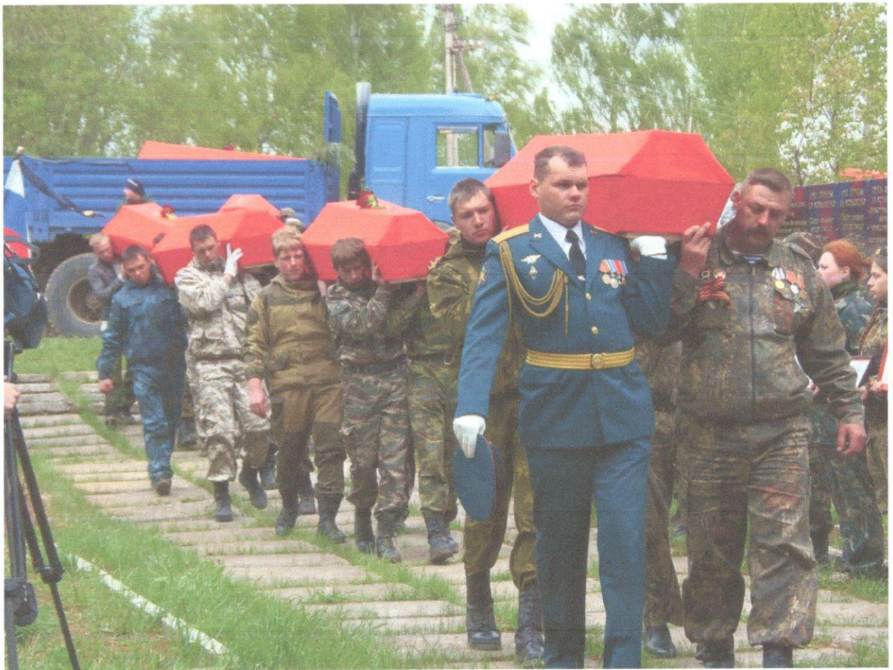
Захоронение солдат в д.Яковлево (Поле Памяти) Глинковского района Смоленской области