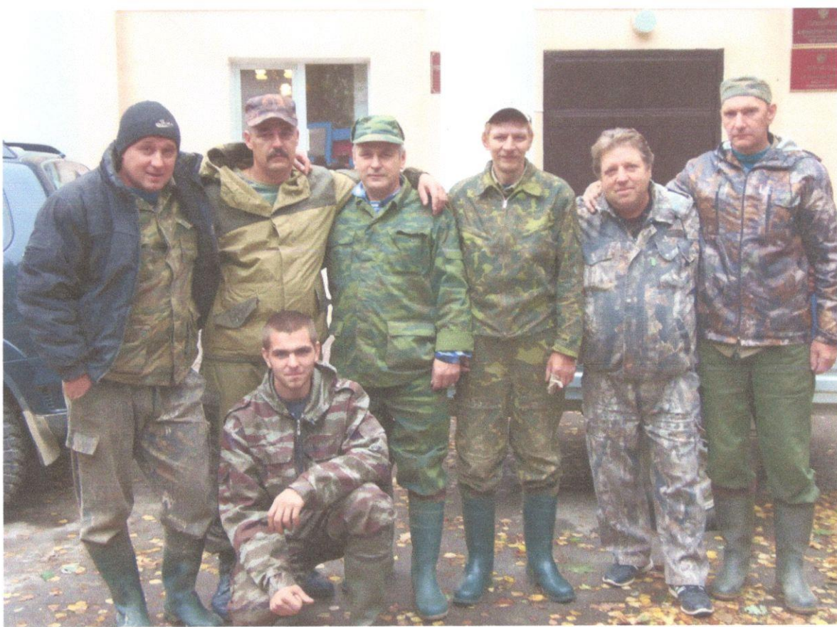
Поисковый отряд «Гвардия» Глинковского района Смоленской области