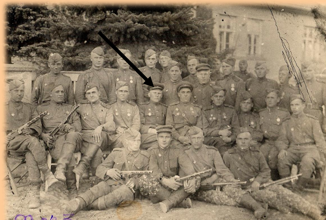
26.04.1945, после освобождения от немецких войск г.Брно, Словакия