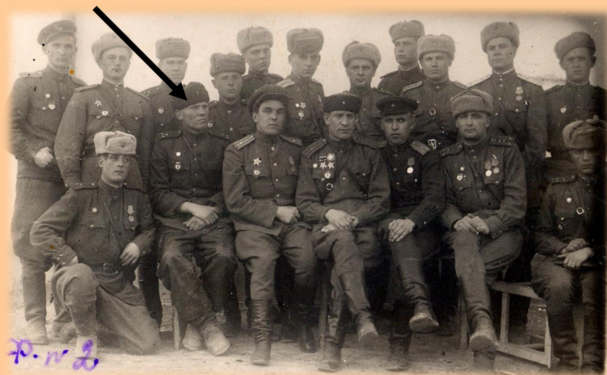
Братиславско-брновская операция 25.03.1945