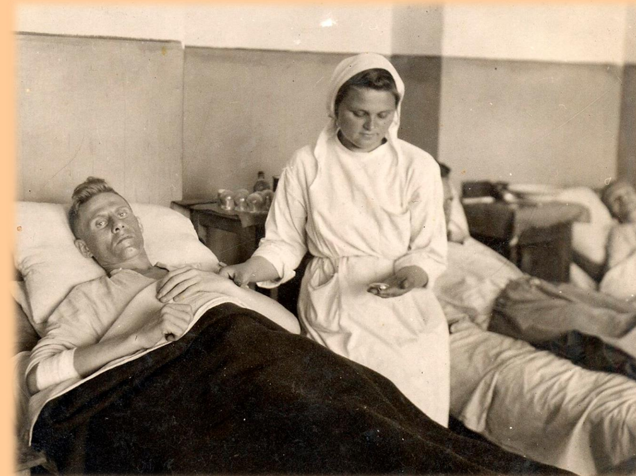
Пулевое ранение в живот, Маньчжурия