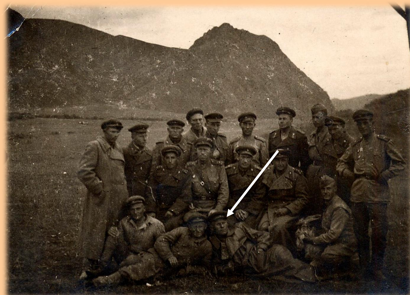
Япония, Маньчжурская операция (1945)