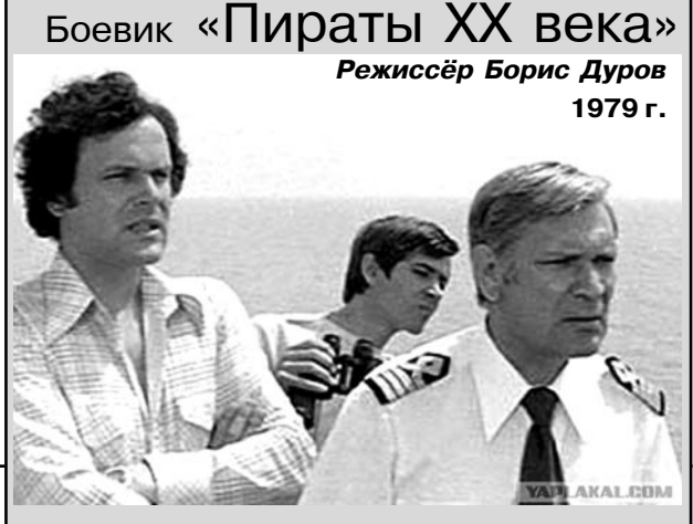
Боевик «Пираты XX века» Режиссёр Борис Дуров 1979 г.

Советское грузовое судно «Нежин» в заграничном порту получает большой груз опия для фармакологической промышленности и направляется во Владивосток.