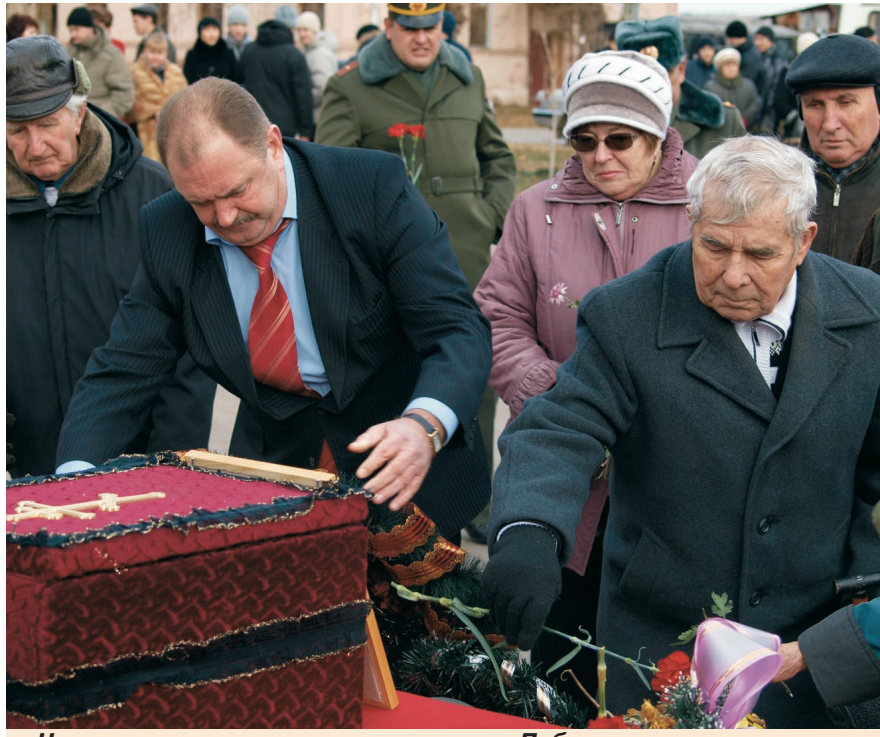
Церемония возложения цветов в парке Победы