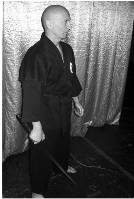
За секунду до выхода на сцену с самурайским мечом

Ещё одна деталь. Если вначале Детхаджиева объявили, упомянув лишь высшую часть его спортивных