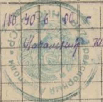
Общие данные по налётам за весь 1943г.