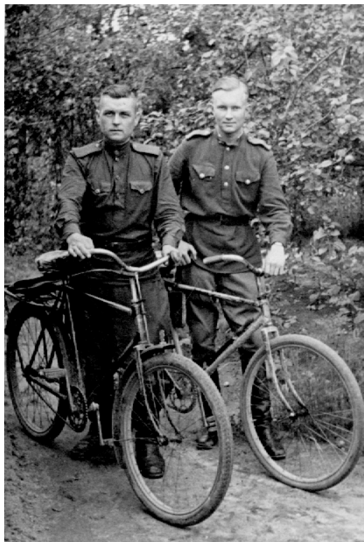
С другом—однополчанином. Фотография датирована: «8 июня 1945 г. Берлин»