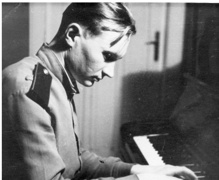
Инструмент, сохранившийся в немецкой квартире, напомнил о довоенной жизни... Берлин, 1945 год.