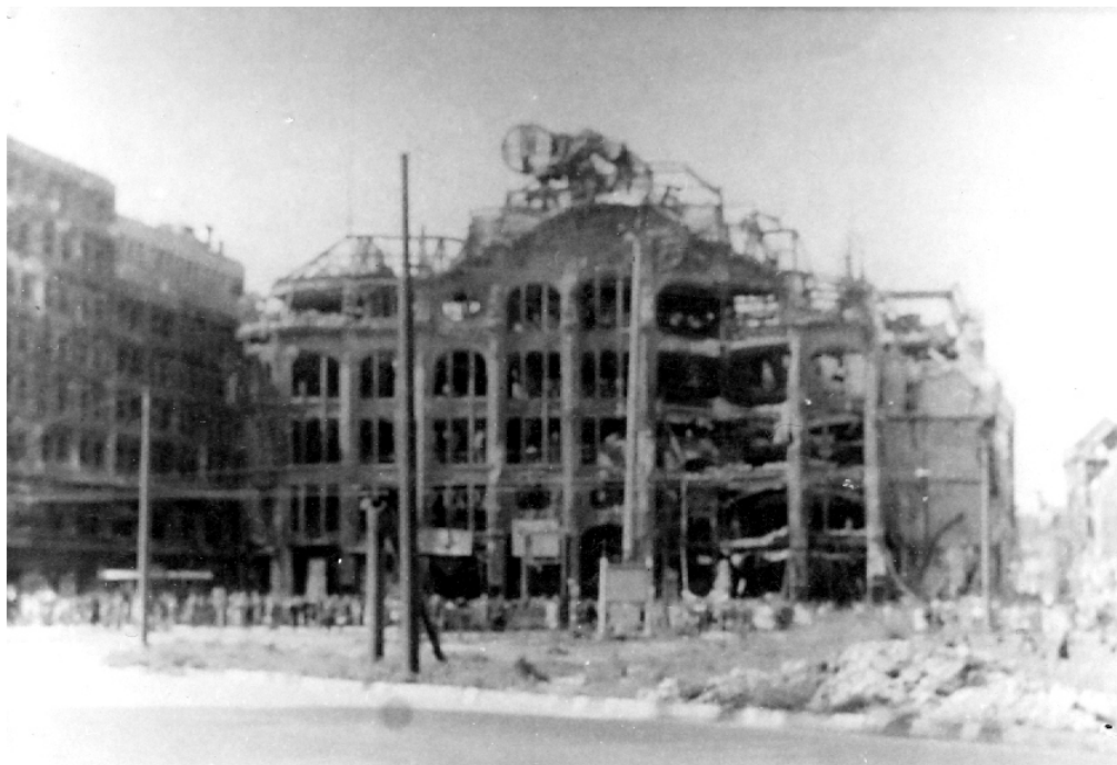
Развалины Берлина Лето 1945 года...