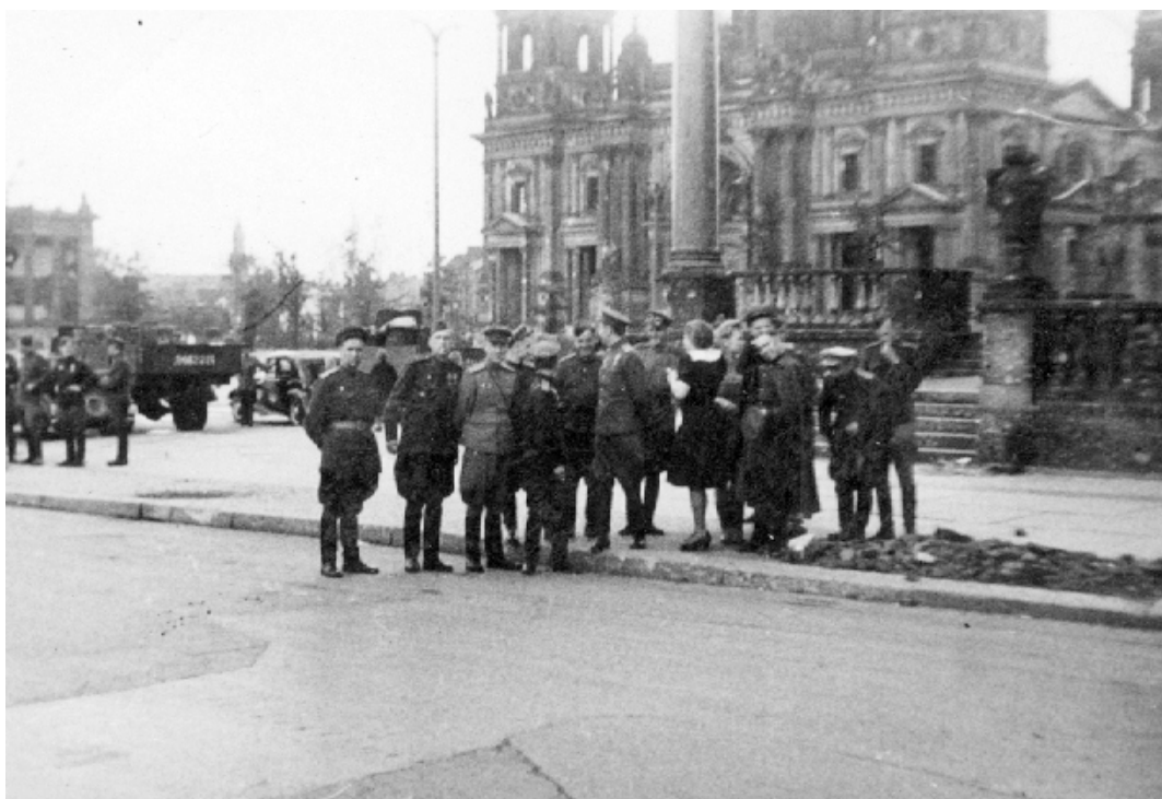
Однополчане у стен разрушенного Берлинского собора - Берлинеркирхе. Весна 1945 года