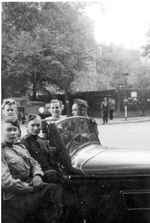
За рулём трофейного «Вандерера». Берлин, 1945 год