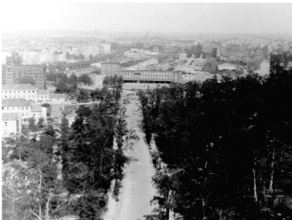
Берлин, 19 августа 1945 года. В конце улицы – тюрьма Моабит, где нацисты держали лидера немецких коммунистов Эрнста Тельмана.