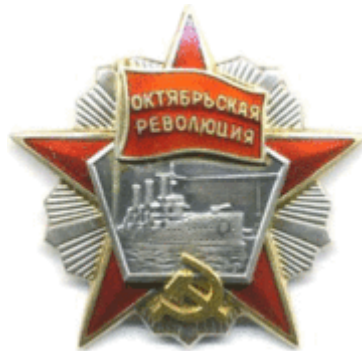
Награждённый орденом Октябрьской Революции крейсер «Аврора» на ордене Октябрьской Революции

Орден при помощи ушка и кольца соединён с пятиугольной колодкой, покрытой шёлковой муаровой лентой красного цвета шириной 24 мм. Посередине ленты пять узких продольных голубых полосок.