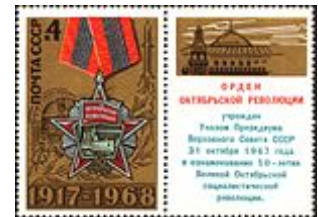
Марка СССР, 1968 г.