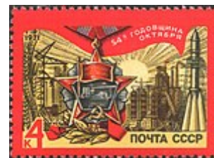
Марка СССР, 1971 г.