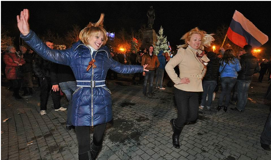
Крымская весна 70 лет спустя