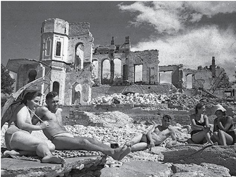
«СНОВА ЖИЗНЬ». Знаменитый советский фотограф Евгений Халдей сделал этот снимок в Севастополе в мае 1944 года, в первые дни после освобождения города