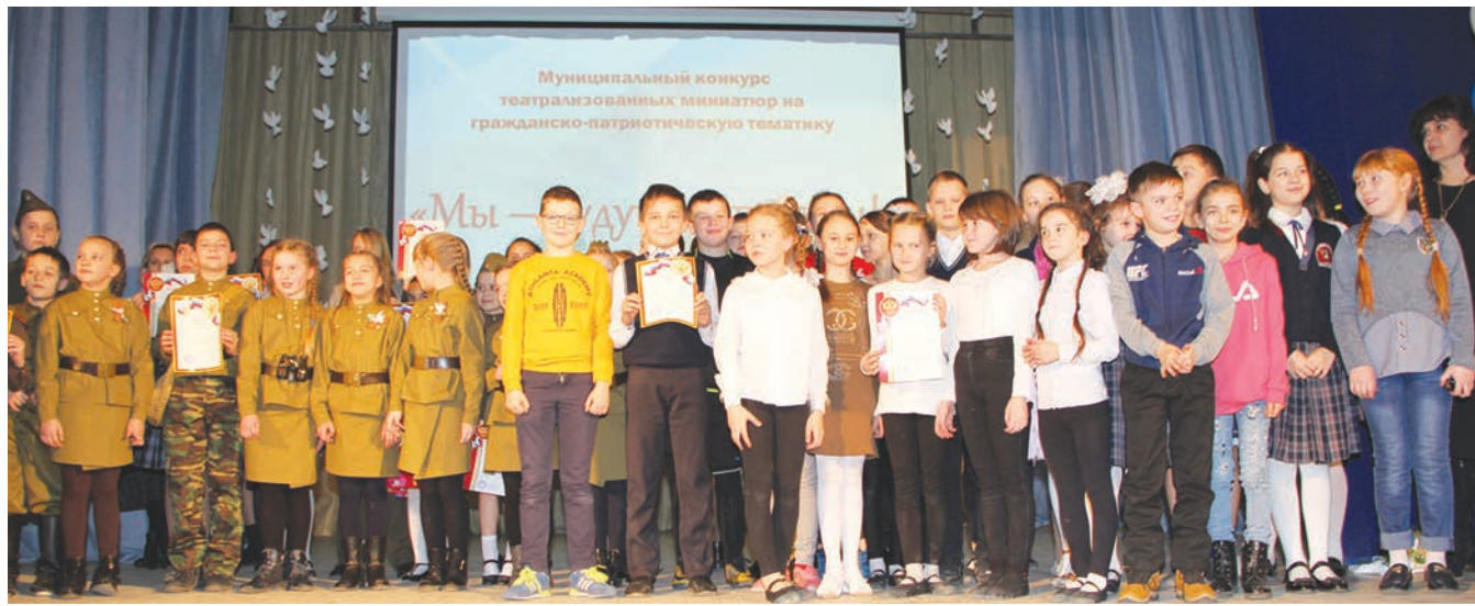
На сцене Центра творчества детей и юношества талантливые дети, обладающие навыками выразительного чтения и артистическими данными.

Районный конкурс театральных миниатюр на гражданско-патриотическую тематику «Мы – будущее страны!» прошёл в МОУ ДО ЦРТДЮ среди учащихся общеобразовательных организаций и организаций дополнительного образования в рамках месячника оборонно-массовой и военно-патриотической работы.