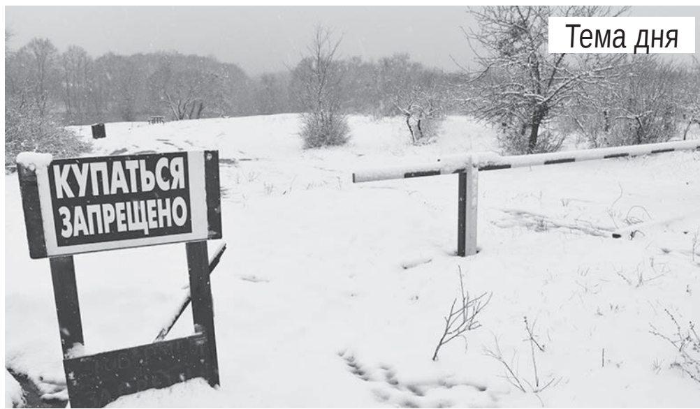
Проход к водоёму в районе Саук-Дере полностью закрыт, подъезды преграждают шлагбаумы.

Для того чтобы ответить на вопрос читательницы и