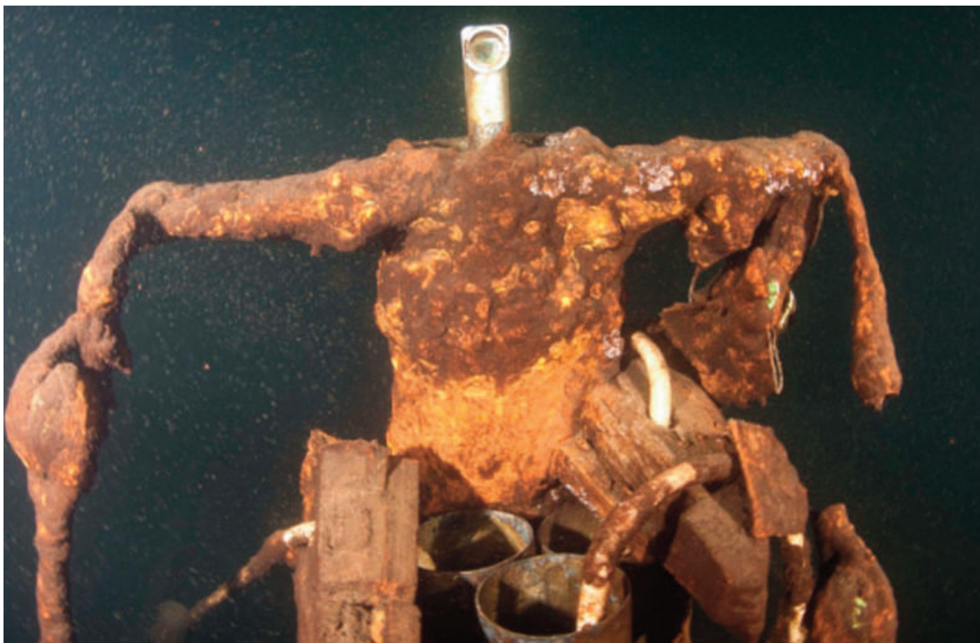
Подводная лодка «Правда», головка перископа.