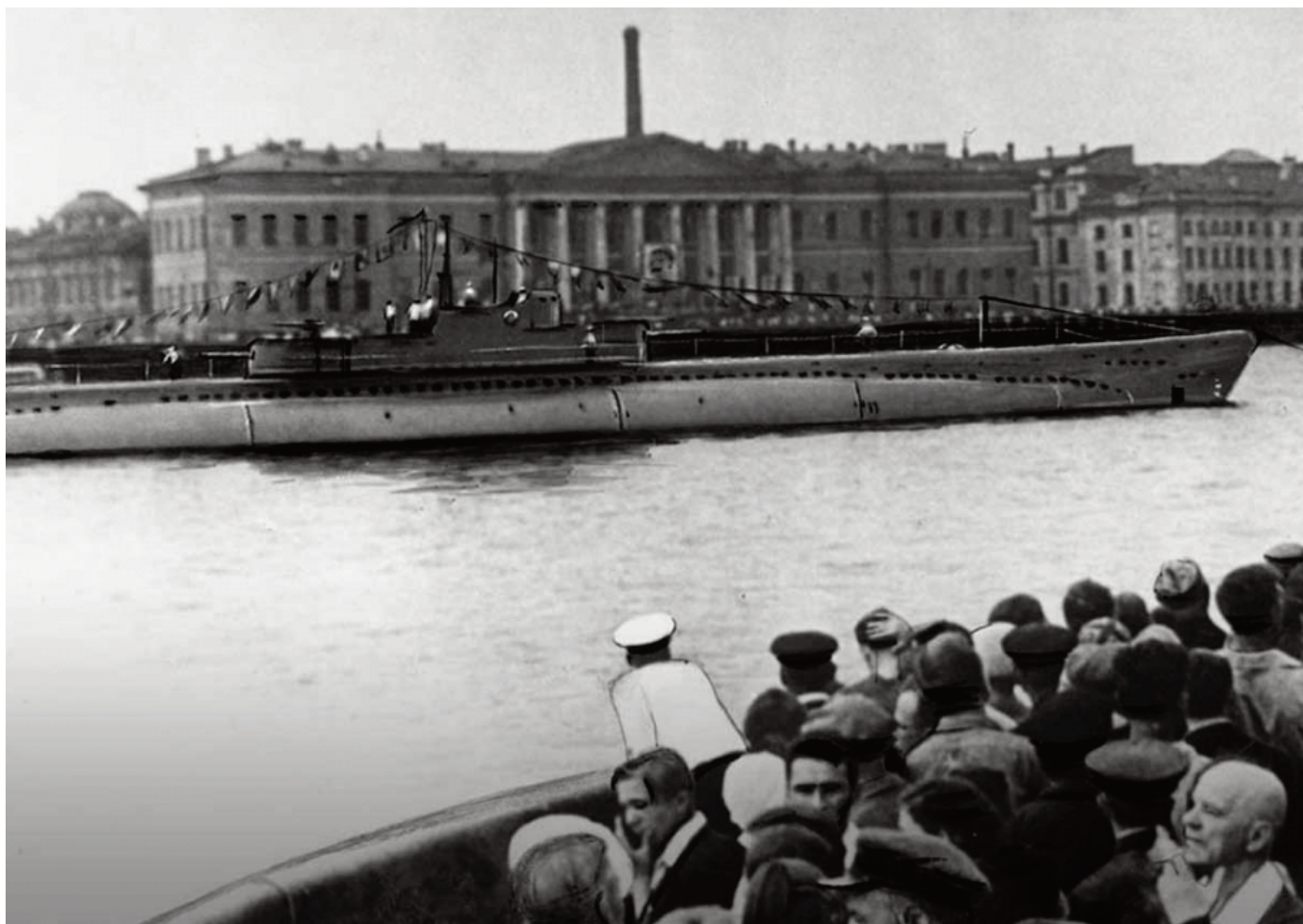
Подводная лодка «Правда» на довоенном параде в акватории Невы. 1936 год.

Враг быстро продвигался к границам Советского Союза. 28 августа 1941 был оставлен Таллинн. 3 сентября с позиций вернулись последние катера, прикрывавшие отход флота из Таллинна. Весь Балтийский флот теперь был сосредоточен между Ленинградом и Кронштадтом. Положение Ленинграда было критическим, немцы были на подходах к окраинам города. Моряки-балтийцы