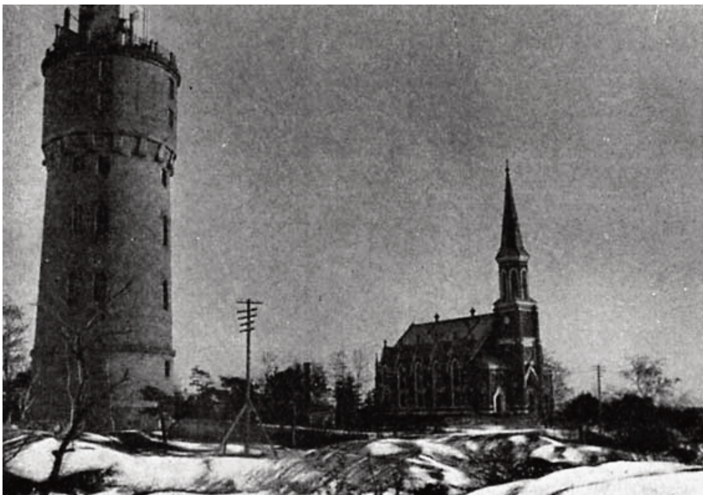
Город Ханко. Водонапорная башня и кирха.

После победы в русско-шведской войне 1808–1809 гг. Финляндия вошла в состав Российской империи. Заняв в 1808 г. полуостров Гангут, русские войска построили здесь укрепления, которые в 1854 г. подверглись мощной атаке англо-французского флота, но ответным огнём русские артиллеристы заставили корабли противника бесславно ретироваться. Во время Первой мировой войны на Ханко в бухте Лаппвик находилась маневренная база Балтийского флота. В декабре 1917 г. Финляндия получила независимость, и русский флот покинул базы на её территории, в том числе и Ханко.