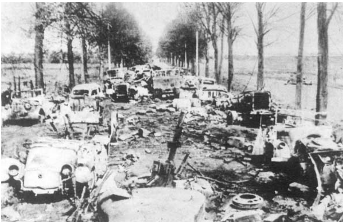
Отлично поработала наша авиация