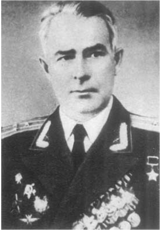
И. В. Шмелев