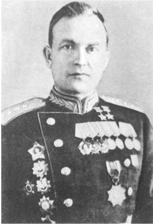
Т. Т. Хрюкин