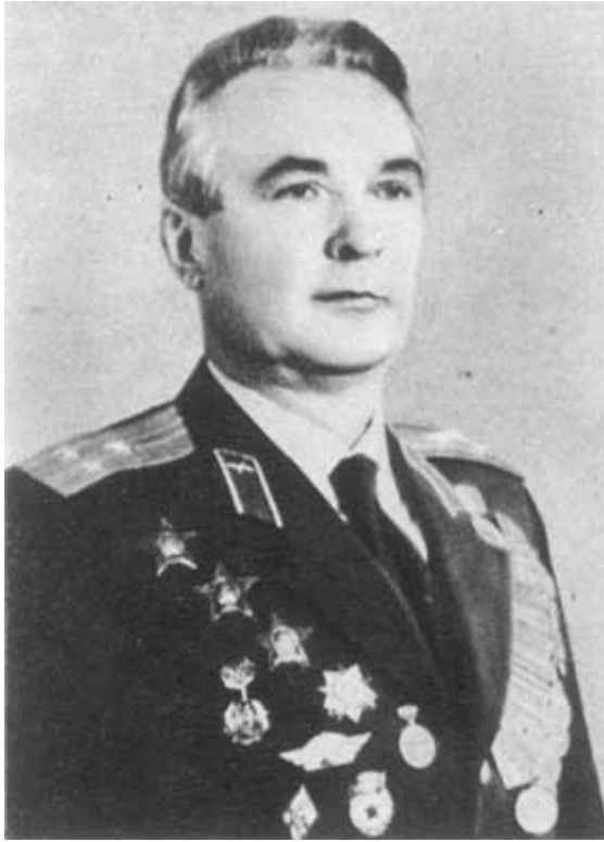
В. М. Егоричев (фото 1974 г.)