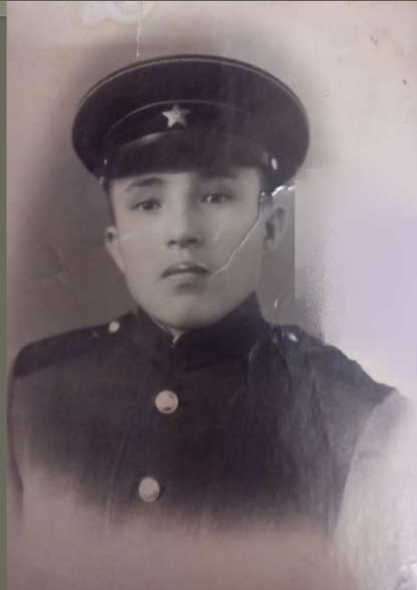
Сын Рева(мой дедушка)