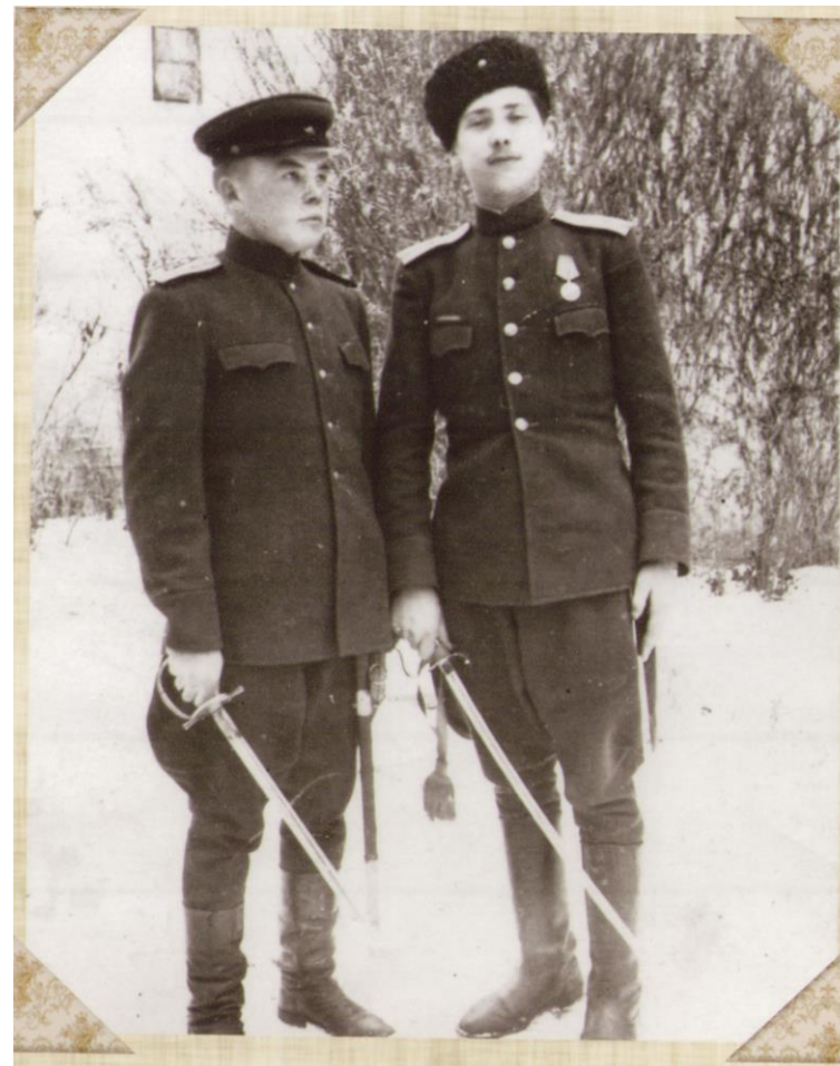
Г. Черновцы 01.01.1945 г. Встреча с другом - кавалеристом