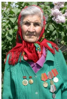
Мир вашему дому