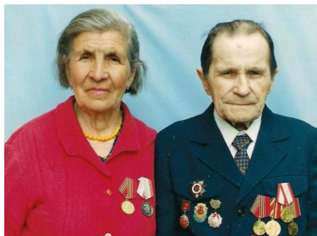
Мать и Отец

Посвящается моим Родителям – ветеранам Великой Отечественной войны, ветеранам Труда