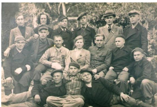
Группа бывших узников