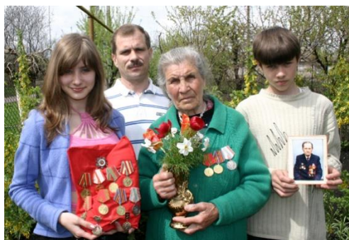
День Победы – 9 Мая

Мои Родители исполнили свой Долг с Любовью и Преданностью, при этом обладая всей Чистотой Внутренней Совести. И когда наступит Всеобщий Мир или Рай на Земле, Там будут именно такие Люди – Созданные, Живущие и Любящие по Образу и Подобию Господа-Бога!