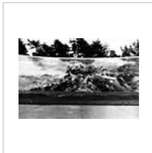
Стела у плаца