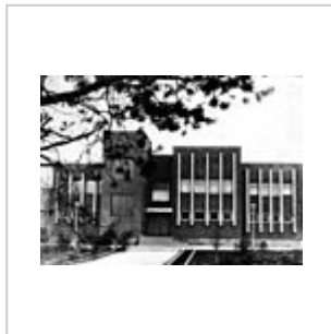
и Винтовочно- артиллерийский полигон