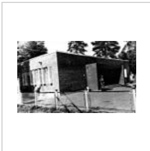
Гауптвахта караульное помещение