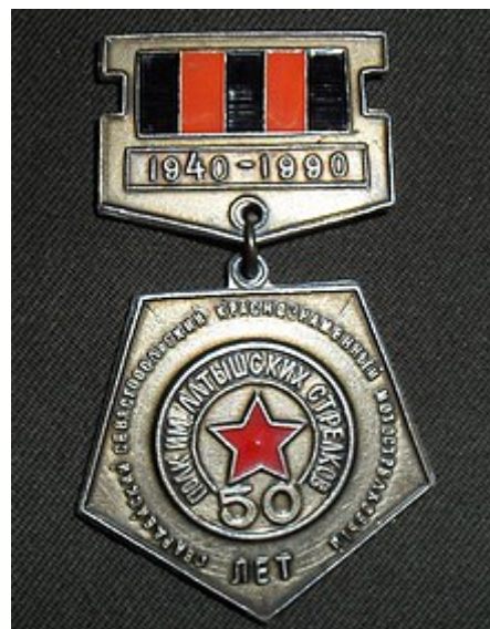
Юбилейная медаль «50 лет гвардейскому Севастопольскому Краснознамённому мотострелковому полку им. Латышских стрелков».