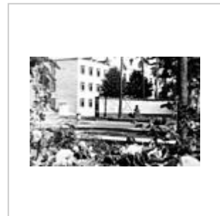
Памятник Черябкину П. Л.