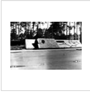
Боевой путь части