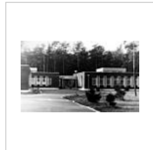
Медицинский пункт полка