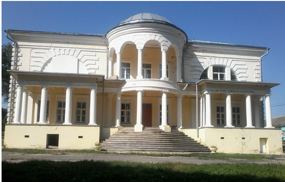
Усадьба Стаховичей в с. Пальна-Михайловка, Липецкая область. 26 июля 2015 года.