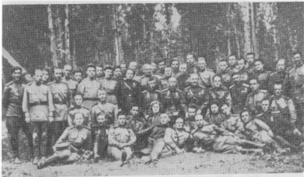
Командный состав 159-го укрепрайона (1944 г.)

преследуемые им вражеские части. Под натиском гвардейцев они отступали по скатам Карпат сюда, в долину.