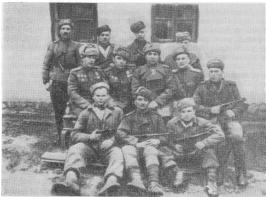
Группа разведчиков 159-го укрепрайона (осень 1944 г.)

Итак, мы шли с боями все дальше в глубь Восточных Карпат. Горная война потребовала внести новые изменения в организацию наступательных действий частей укрепленного района. Впрочем, основа этих новшеств — создание подразделений, оснащенных легким оружием и поэтому лучше приспособленных к атаке, — осталась прежней. Но теперь она получила дальнейшее развитие и, кроме того, мы приспособили ее к горным условиям.