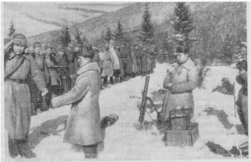
Вручение наград воинам 159-го укрепрайона в Высоких Татрах

фронты в Восточной Пруссии, между Вислой и Одером. Это — справа от нашего 4-го Украинского фронта. Слева же 3-й Украинский фронт участвовал в отражении контрударов, пмевших целью прорвать кольцо окружения, сомкнувшееся вокруг будапештской группировки немецко-фашистских войск, а правым своим крылом наступал на юге Словакии, взаимодействуя с 4-м Украинским фронтом.