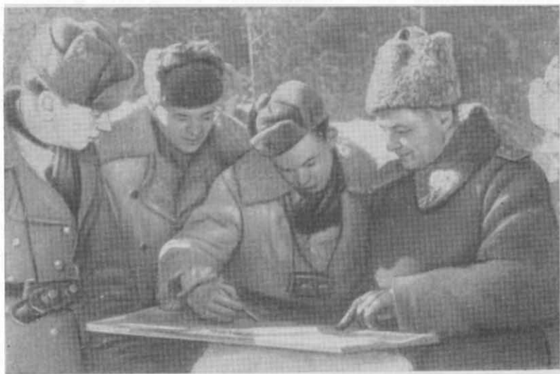
Перед боем в горах Чехословакии (январь 1945 г.)

скрытно, все же противник, по-видимому, что-то «учуял». Об этом свидетельствовало усиление его разведывательных действий.