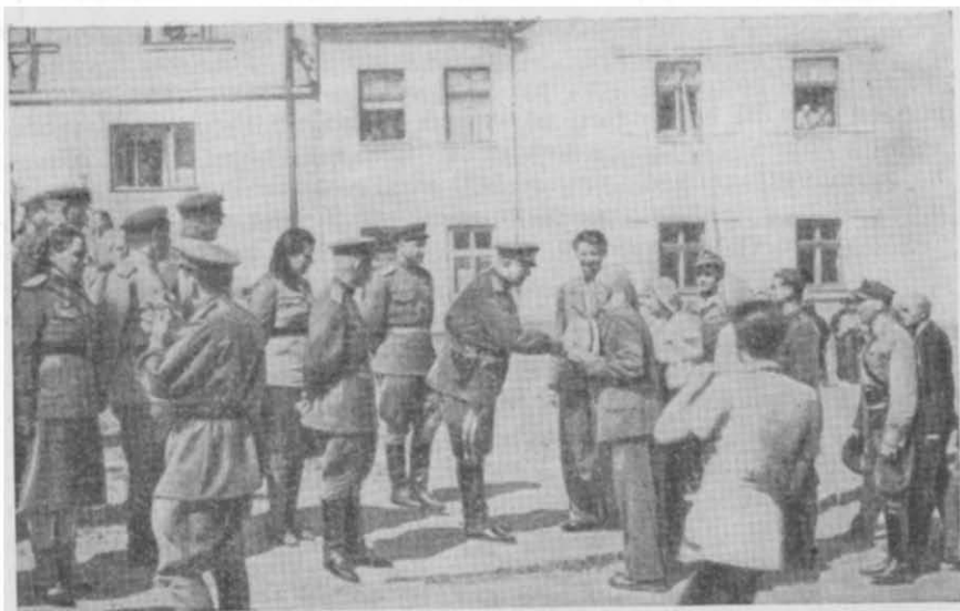
Мэр чехословацкого города Яблоне приветствует советских воинов, возвращающихся на Родину после победы над фашистской Германией (июнь 1945 г.)

неблагоприятно начавшейся войны в войну победоносную, имеющую конечной целью разгром гитлеровской Германии, искоренение злейшего врага человечества — фашизма.