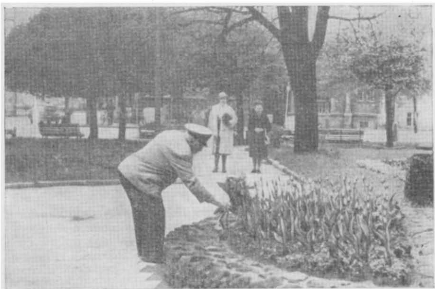
20 лет спустя в г. Крнов (Чехословакия) у братской могилы советских воинов, павших в бою за освобождение этого города

ственно задачам наступления. Теперь здесь имелись три батальона автоматчиков, усиленные артиллерией, минометами и саперными подразделениями, а также сильный резерв — стрелковый полк и артиллерийский дивизион. Кроме того, были подготовлены еще шесть взводов автоматчиков. Они и атаковали противника первыми.