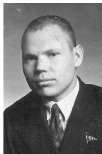
Георгий Иванович Черепанов