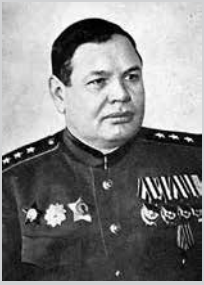
По по в Василий Степанович (1893 — 1963), со 2 февраля 1942 г. по апрель 1944 г. — командующий 10-й Армии, генерал-майор, с 26 июля 1944 г. — генерал-полковник. Герой Советского Союза

В 1097 сп опорные пункты не имеют твердых боевых расчетов, отвечающих за оборону опорного пункта. Это приводит к ненужной и опасной толчее и беспорядку во время тревоги: по сигналу сап[ерная] рота, рота связи и сан[итарная] рота 1101 сп явились к одному опорному пункту, помещение которого оказалось занятым лошадьми Барятинского гарнизона;