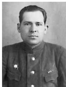
Г. И. Вавилов

Приказом Военного совета Западного фронта № 687 от 15 июня 1942 г. награжден орденом Красной Звезды.