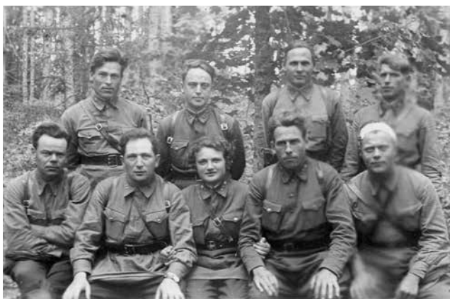
Командный состав 326-й стрелковой дивизии. 1942 г.

1101 сп продолжал очистку леса от пр[отивни]ка, действуя по просекам и дорогам Алешинка — сев[ерный] берег р. Жиздра.