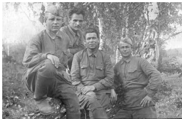
Группа бойцов 326-й стрелковой дивизии. 1942 г.

3. 326 сд с рассветом 20.08.42 г. перешла в наступление двумя батальонами на выс. 180,3. При достижении выс. 180,3 * два батальона повернули фронтом на юг, два батальона — фронтом на север, ведя бой по уничтожению