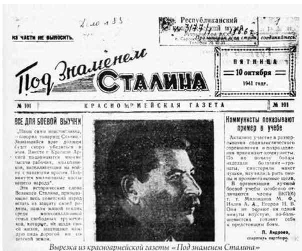
Вырезка из красноармейской газеты «Под знаменем Сталина»