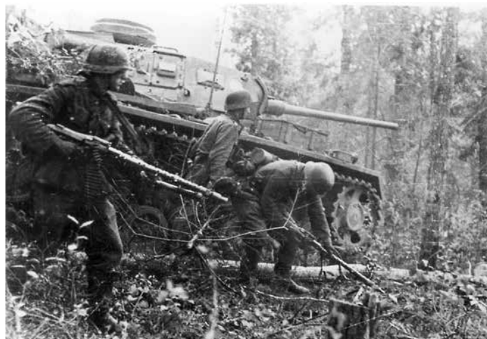
Наступление немецкой мотопехоты (2-го батальона 40 пцп 17 тд и 59 мцб 9 тд) при поддержке танков (предположительно 3-го батальона 15 тп 11 тд) на участке обороны 1097-го стрелкового полка 326-й стрелковой дивизии в лесу северо-восточнее д. Колодези. Фотография снята фотографом немецкой 693-й роты пропаганды 2-й танковой армии лейтенантом Краувангером (Krauwanger). 23 августа 1942 г. Личный архив И. А. Черняева

4. В ходе боев установлена следующая тактика немцев в проведении лесных боев: немцы создают боевую группу, состоящую из танка с пехотным десантом и минометчиков. Эта группа действует следующим образом: впереди двигаются танк с пехотным десантом на нем;