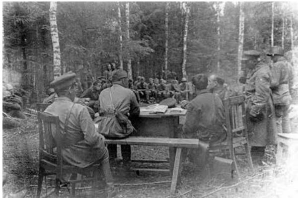
Совещание в 1099-м стрелковом полку по обмену опытом снайперской стрельбы. 1942 г.

Таким образом, 326-я стрелковая дивизия по-прежнему продолжала оставаться без минимального прикрытия ПВО в виде 37-мм зенитных орудий, обладала низкой скоростью гужевого транспорта, но выделялась в лучшую сторону укомплектованностью стрелковых полков 45-мм ПТО и отдельного тяжелого минометного дивизиона, который сочетал подвижность с мощной огневой силой.