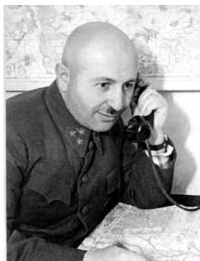
И. Х. Баграмян

<...> 9 февраля 1943 года я был вновь вызван в штаб фронта, где получил от командующего задачу на подготовку наступательной операции в направлении Жиздры в целях содействия войскам Брянского и Центрального фронтов в овладении Брянском. <...>