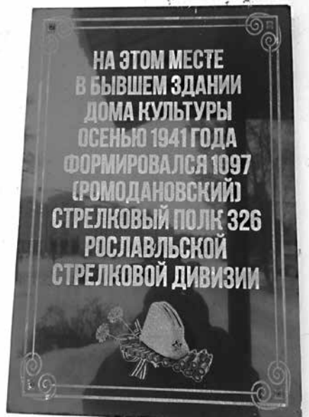
Мемориальная доска на здании в пос. Ромоданово, в котором формировался 1097-й стрелковый полк. ММВТП