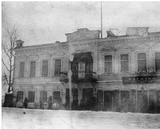
Здание бывшего Дома колхозника по ул. Л. Толстого.