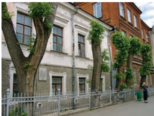
Здание по ул. Володарского, в котором в 1941 г. располагался штаб 326-й стрелковой дивизии.