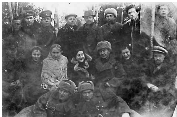
Артисты из Мордовии в 326 сд. 1942 г.

2. Положение частей дивизии без перемен, уточняется положение 1011 сп: 1-й батальон 1101 сп (90 боевых штыков) с 08.00 21.03.42 г. обороняет район Шемелинки, Стар[ая] Слобода, Нов[ая] Слобода, Ракитня.