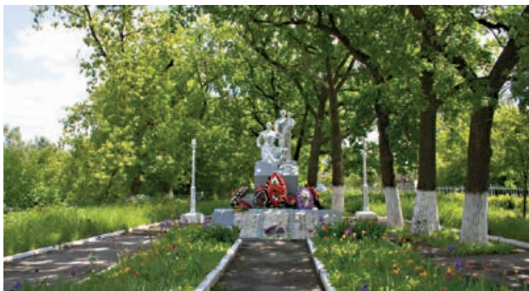
г. Плавск. Братская могила № 1