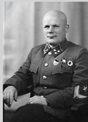
Ф. И. Голиков – командующий 10-й армией Западного фронта с 21 октября 1941 г. по 1 февраля 1942 г.

Г о л и к о в Филипп Иванович (1900 — 1980), Маршал Советского Союза (1961). Родился в д. Борисово ныне Курганской области. В Красной армии с 1918 г. Участник Гражданской войны. Окончил курсы усовершенствования высшего начсостава (1929), Военную академию им. М. В. Фрунзе (1933). До 1931 г. на партийно-политической работе, затем на командных должностях. В 1939 г., командуя 6-й армией, участвовал в освобождении Западной Украины. С июля 1940 г. — начальник Главного разведывательного управления Генерального штаба. Во время Великой Отечественной войны командовал с октября 1941 г. 10-й армией, с февраля 1942 г. — 4-й ударной армией, с апреля 1942 г. — войсками Брянского, а с июля 1942 г. — Воронежского фронтов. В августе — октябре 1942 г. — командующий 1-й гвардейской армией и зам. командующего войсками Сталинградского и Северо-Западного фронтов. С октября 1942 г. вновь командовал войсками Воронежского фронта. С апреля 1943 г. — начальник Главного управления кадров и с октября 1944 г. — одновременно уполномоченный СНК СССР по делам репатриации. После войны — начальник Военной академии бронетанковых войск, начальник Главного политического управления Советской армии и Военно-морского флота. Награжден четырьмя орденами Ленина, орденом Октябрьской Революции, четырьмя орденами Красного Знамени, орденами Суворова 1-й степени, Кутузова 1-й степени, Красной Звезды, семью иностранными орденами, медалями.