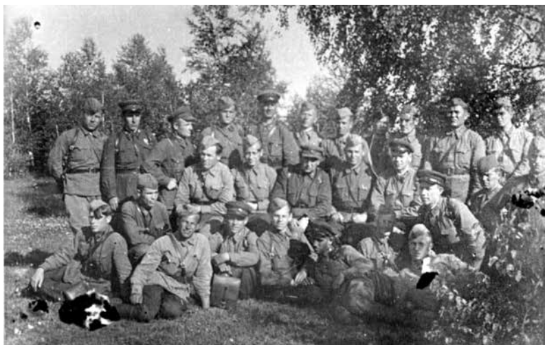
Совещание политсостава 326-й стрелковой дивизии в районе р. Жиздры. 20 августа 1942 г.

ЦАМО. Ф. 10654. Оп. 1. Д. 2. Л. 49. Заверенная копия.