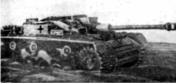
Подбитый немецкий танк

Кроме того, пр[отивни]к выбрасывал танковые десанты как на Гредякино, так и Холм-Березуйский из направления роши Фигурная и выс. 205,1 и их продвижение обеспечивал арт[иллерийско]-пулеметным огнем из кочующих танков. Такой тяжелый танк пр[отивни]ка Т-4* был подбит в 200 м с[еверо]-з[ападнее] Гредякино в 07.30 01.12.42 г.