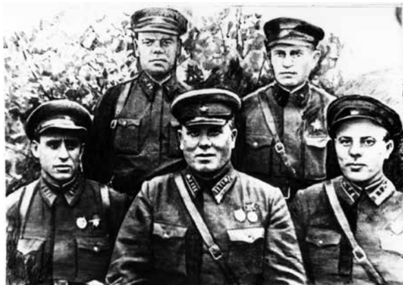
Командный состав дивизии.

Родился в 1907 г. в г. Саратове ныне Саратовской области. Русский, член ВКП(б). В Красной армии с 1932 г. Участник советско-финляндской войны 1939 — 1940 гг. В 326-й стрелковой дивизии с 14 октября 1941 г., с 16 июля 1942 г. — полковой комиссар, с 9 октября 1942 г. — заместитель командира дивизии по политчасти — до 22 мая 1943 г. Позднее был комиссаром и заместителем командира 36-го стрелкового корпуса, полковник. Награжден также медалью «За победу над Германией в Великой Отечественной войне 1941 — 1945 гг.».