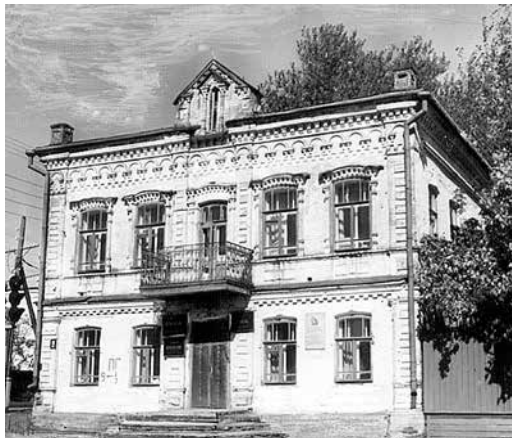
Здание Дома учителя по ул. Советская, в котором располагался командный состав 326-й стрелковой дивизии.