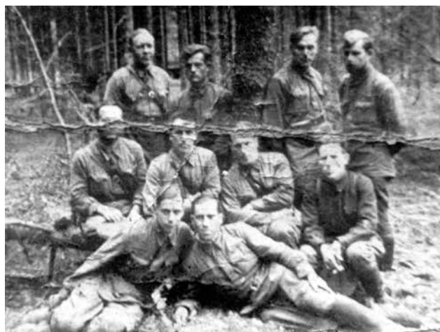
Бойцы 326-й стрелковой дивизии. 1942 г.

ЦАМО. Ф. 10654. Оп. 1. Д. 2. Л. 38 — 39. Заверенная копия.