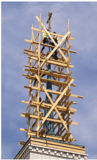
Воздвижение креста Господня на шпиль колокольни Никольского храма