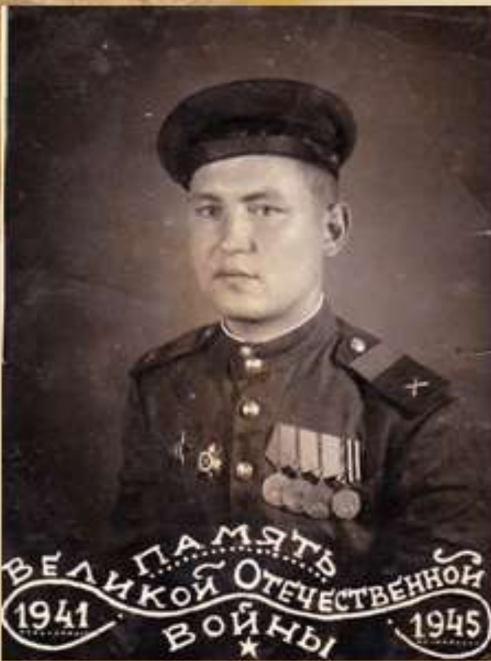
После войны 1945 год