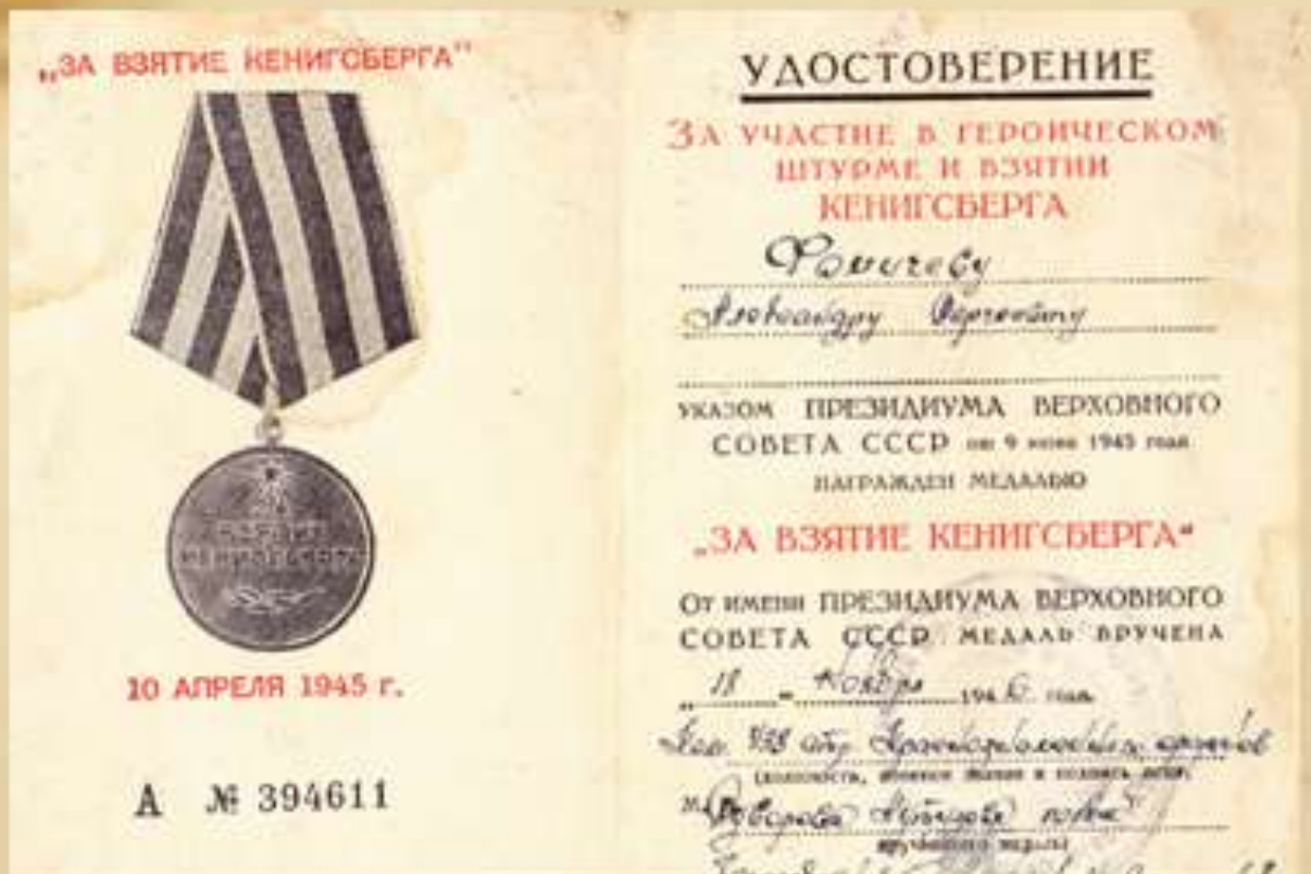
Удостоверение к медали «За взятие Кёнегсберга»