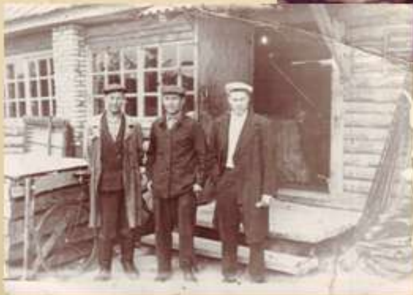
На работе совхоз «Мальшевский 1966 год»