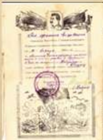
Благодарность за за Найденбург и Алендорф