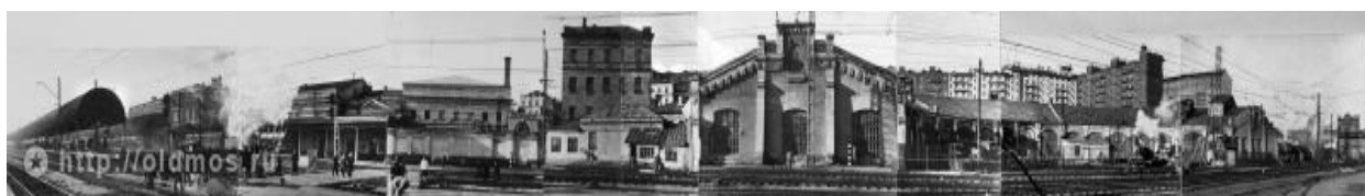
Общий вид паровозного депо Курского вокзала