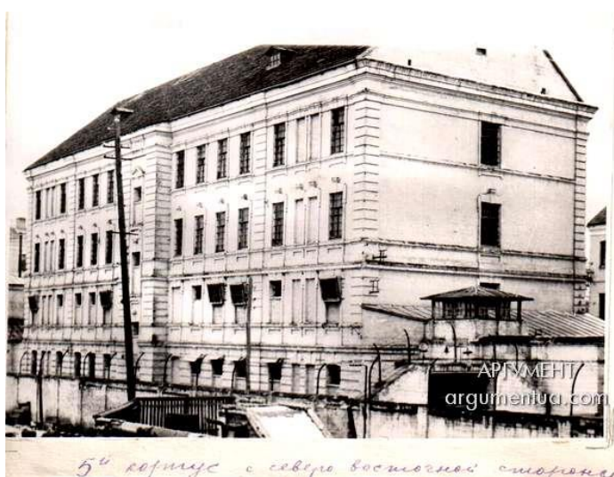
Пятый корпус тюрьмы «Холодная гора», Харьков