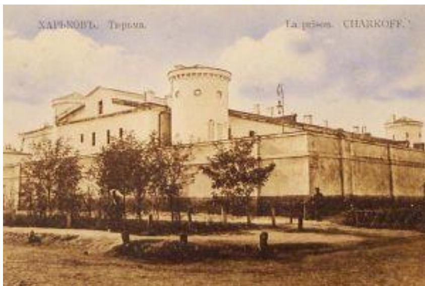
Харьковская тюрьма «Холодная гора»