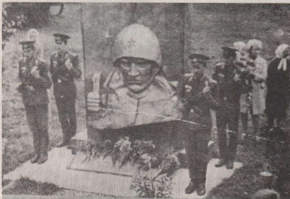
Практически круглый год у памятника, возведенного в деревне Машкино на могиле погибших воинов, — живые цветы, как знак священной памяти о мужественных защитниках Отечества.

Освобождение нынешней территории района (тогда Суражского) началось осенью 1943, а окончилось 27 июня 1944 года. Освобождали район и г. Витебск 39 армия 3 Белорусского (левобережье З. Двины) и 43 армия 1 Прибалтийского (правобережье) фронтов. Большие потери понесла 11 армия 1 Прибалтийского фронта, которая вела здесь боевые действия в конце 1943—начале 1944 годов.