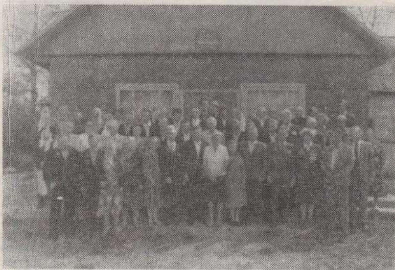
1989 год. Встреча ветеранов войны и труда—тружеников совхоза «Зароново».

Зароновцы хорошо знают, какой ценой завоеван мирный сегодняшний день и низко склоняют головы перед светлой памятью тех, кто в боях с ненавистным врагом отстоял честь, свободу и независимость Родины. Они с оптимизмом смотрят в будущее и, своим самоотверженным трудом укрепляя экономику Придвинского края, вносят посильный вклад в решение великих задач социального созидания.