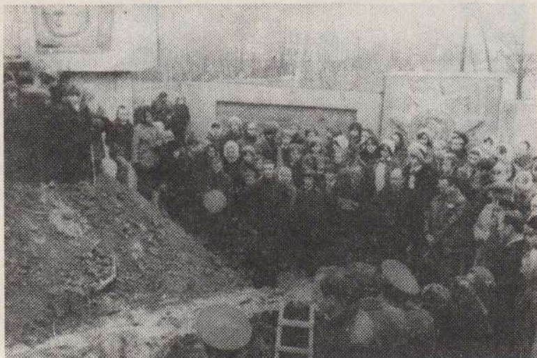
1976 год. Перезахоронение останков советских воинов и партизан, погибших на зароновской земле.

27 июня фашисты сложили оружие, попав в Витебский «котел» и потеряв 20 тысяч убитыми, 10 тысяч пленными, много оружия и боевой техники.