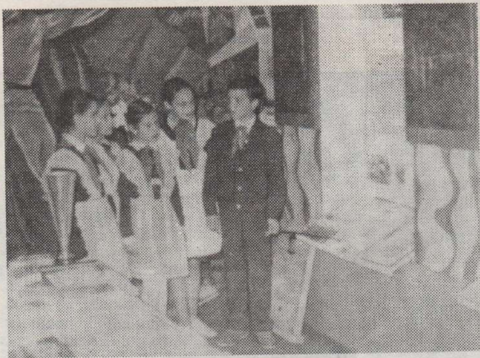
В музее народной Славы.