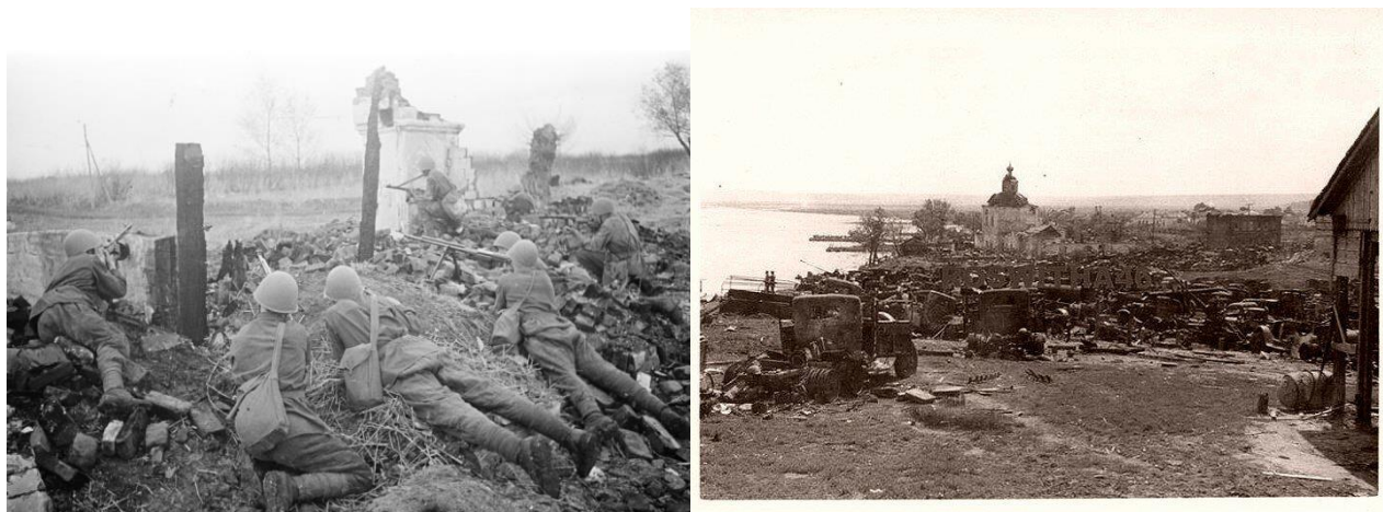
Архивное фото. Оккупация Коротояка в 1942 году

В наши дни ежегодно 9-го мая в память о погибших советских воинах благодарные жители Коротояка опускают на воду венки с зажженными свечами. Один венок обозначает один год, прошедший в мире после Великой Победы. Вереница из множества горящих свечей на воде, плывущих по воде вниз по Дону,- зрелище торжественное и красивое.